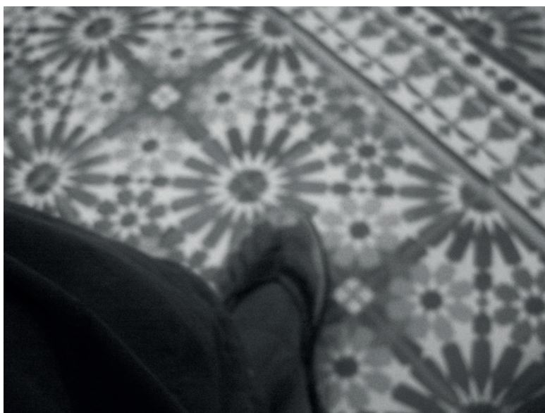
Figura 4. Imagen encontrada en una tarjeta SD, 2011.