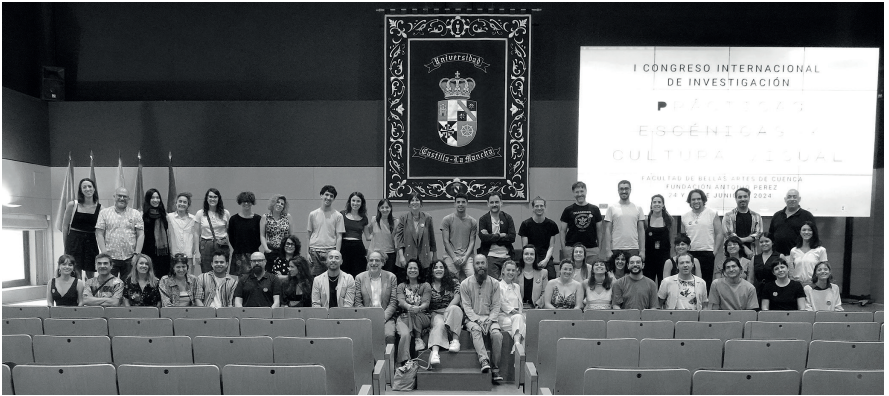
Ponentes del I Congreso internacional. ARTEA