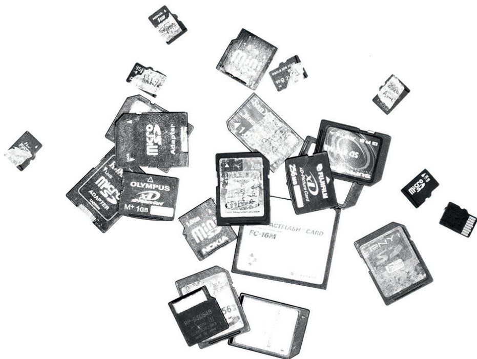
Figura 1. External memories. Youssef Taki

la maquinaria de representación dentro de la web 2.0 o el ecosistema de la nube. Busca rescatar aspectos de la vida cotidiana almacenados en dispositivos digitales físicos de los 2000. La pérdida y la desaparición de estos archivos es una constante; ya sea por ahorrar espacio, por rotura de los dispositivos, o simplemente por un descuido, perdemos gran parte de los documentos que producimos. Estos documentos reflejan un testimonio viviente, una ventana hacia nuevas narrativas individuales y colectivas. Personalmente, los rescato, los cuido y los almaceno para que no se pierdan en la vastedad del olvido digital.