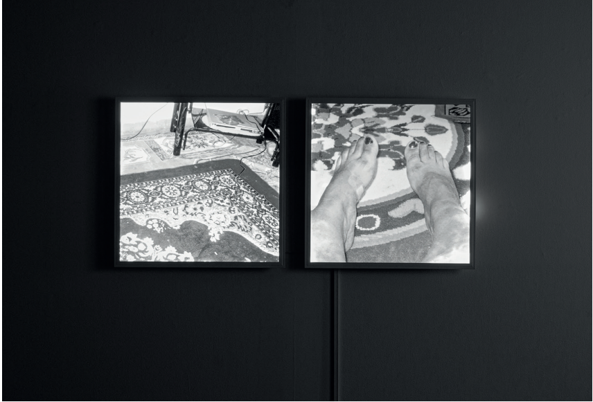
Figura 3. External memories. Youssef Taki