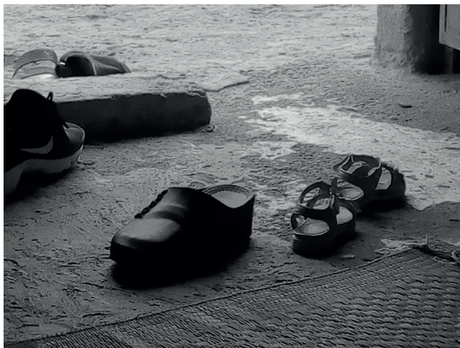
Figura 4. Imagen encontrada en una tarjeta SD, 2011.