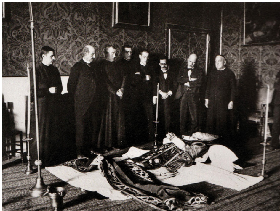
Fig. 1. Cadáver del cardenal Monescillo en la antecámara de su dormitorio (Palacio Arzobispal, 11 de agosto de 1897).

muerte del cardenal Monescillo (1897) hasta la presentación que Garcés hizo en 1914 del niño Marcial Lalanda, quien años más tarde habría de convertirse en un célebre torero. La evolución técnica de la fotografía —cámaras más compactas, menor tiempo de exposición de la película, etc.— permitirá pronto una mayor interacción del fotógrafo con su entorno. A La Campana Gorda se sumarán otros medios impresos ampliamente ilustrados, como por ejemplo El Castellano Gráfico (Editorial Católica Toledana, 1924-1925), con imágenes de Pablo Rodríguez (1897-1975) en su mayor parte.