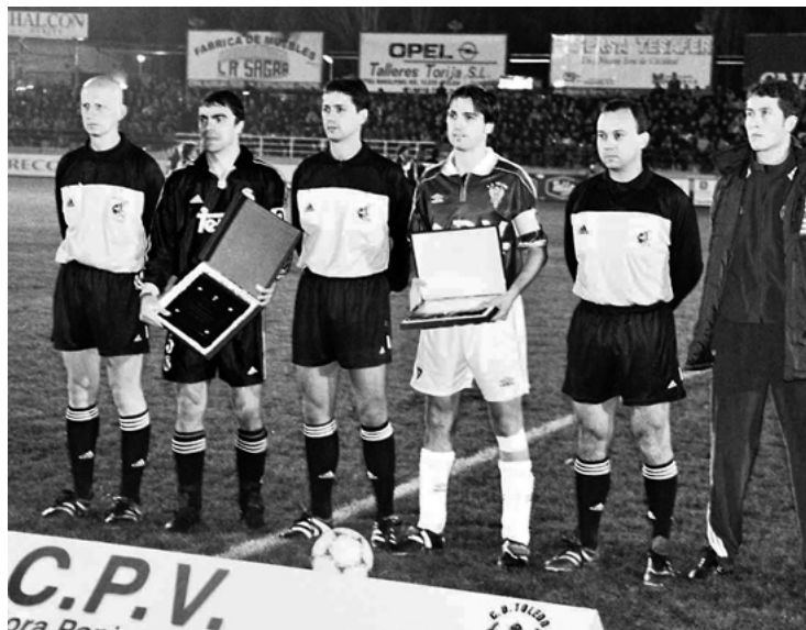
Fig. 6. Amplio fondo deportivo: la histórica victoria del CD Toledo contra el Real Madrid en Copa del Rey el 13 de diciembre de 2000.

También es preciso destacar las romerías, de las cuales la más multitudinaria es la de la Virgen del Valle. Al igual que las celebraciones anteriores, permiten recoger escenas de la tradición popular, en este caso aprovechando los espacios naturales que rodean el casco histórico y tomando también a este como referente.