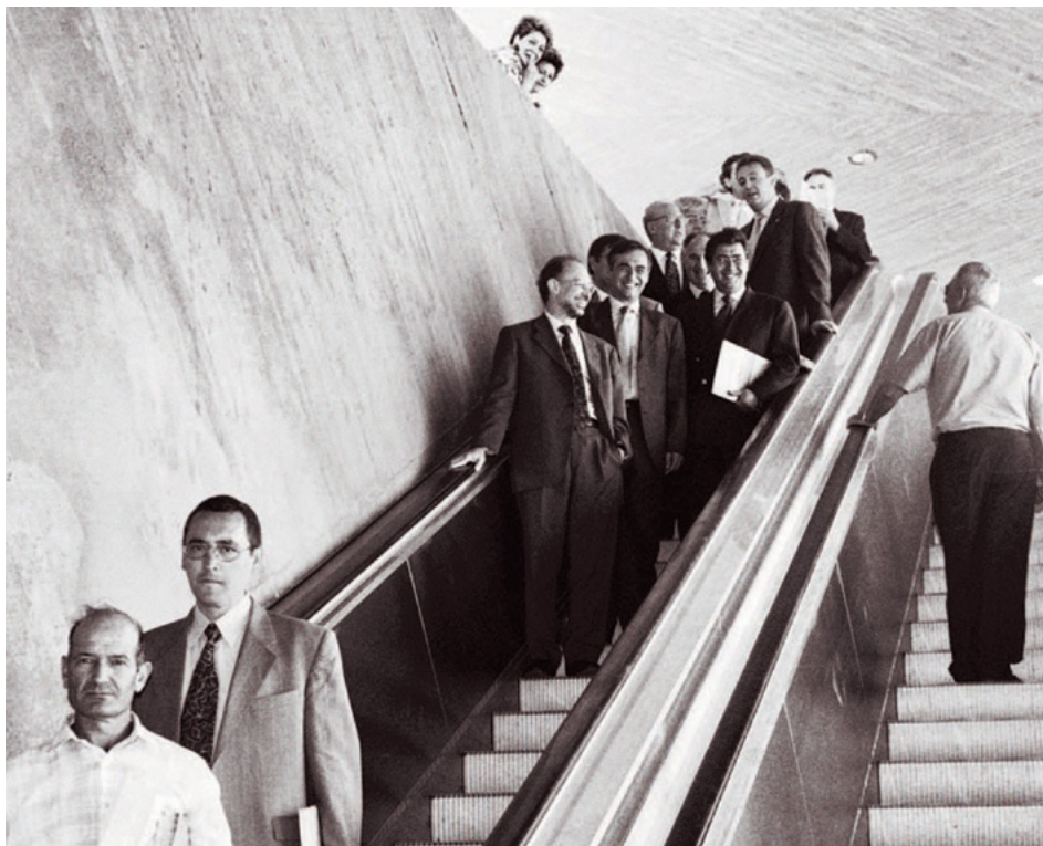
Fig. 2. El ministro Cristóbal Montoro acude a la inauguración del Remonte de La Granja (19 de junio de 2000): la fotografía como herramienta para el desarrollo de infraestructuras.