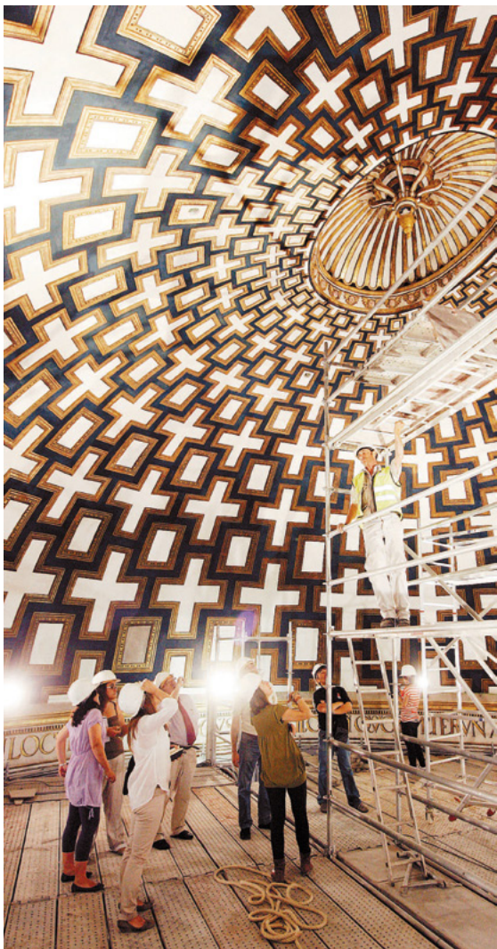
Fig. 5. Fotografía y patrimonio: Restauración de la bóveda elíptica de Santo Domingo el Real en 2011, una de las muchas actuaciones del Consorcio documentadas por La Tribuna de Toledo .

Kofi Annan, secretario general de la ONU (1999), o el presidente de Venezuela Hugo Chávez (2004). Recientemente, los días 30 y 31 de agosto de 2023, la cumbre europea de Defensa y Asuntos Exteriores reunió en el Campus de la Fábrica de Armas a representantes de numerosos países, dando lugar a unas fotografías que sin duda serán recordadas en el futuro.