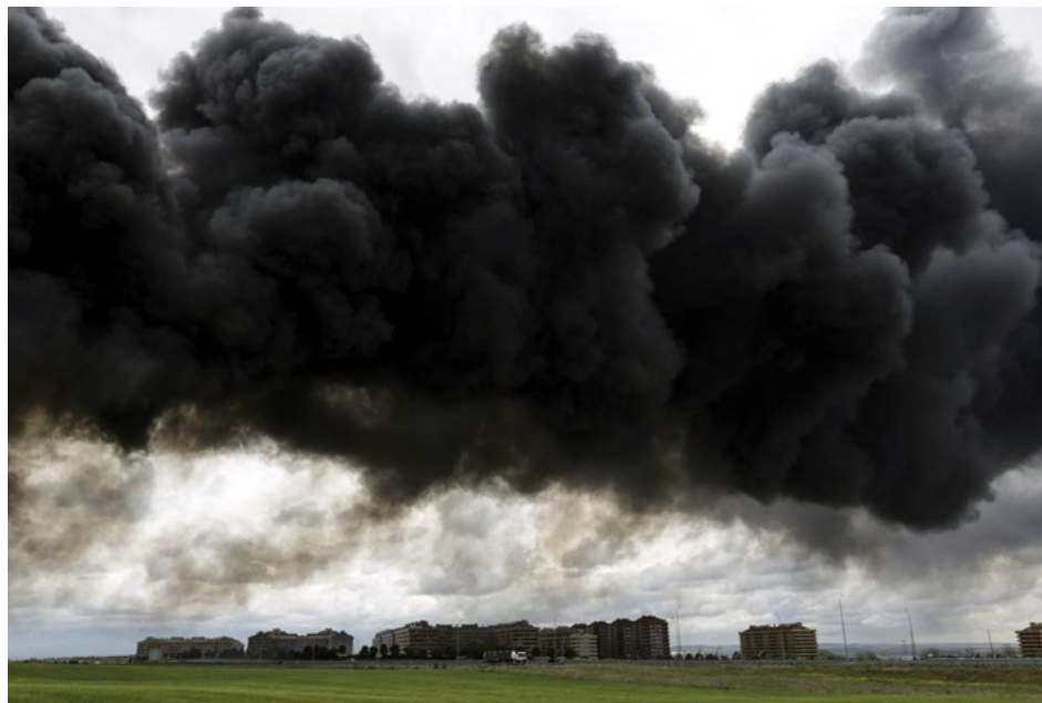
Fig. 3. Incendio en el cementerio de neumáticos de Seseña, el más grande de España (12 de mayo de 2016).

mo están las imágenes de la manifestación con que Toledo se pronunció contra el brutal atentado de Atocha, mostrando la plaza de Zocodover y sus calles aledañas absolutamente cubiertas con los paraguas bajo los que miles de vecinos intentaban protegerse de la lluvia.