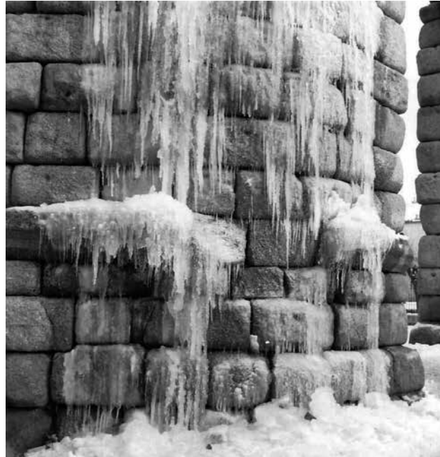
3. Acueducto helado.