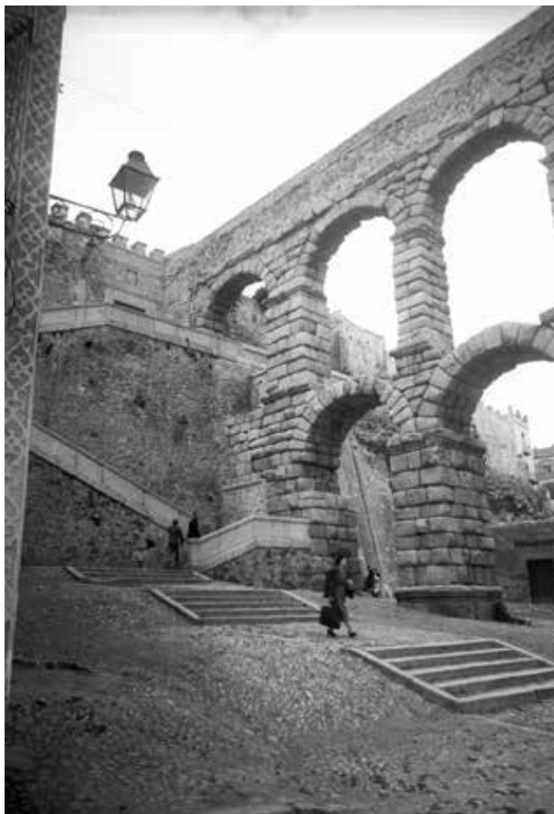
4. Segovia. Un rincón del Acueducto.