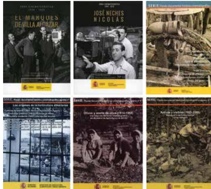
7. Cubiertas de algunas de las colecciones de obras recuperadas, pertenecientes al Fondo Histórico Cinematográfico Agrario (Mediateca. S.G.T-MAPA)

La consulta y reutilización de los citados fondos documentales se ha articulado a través de la Sección correspondiente de la Web del Departamento (donde se ofrece una significativa muestra), y creando una nueva Serie Editorial propia "Fondo documental histórico cinematográfico agrario", donde se han publicado las