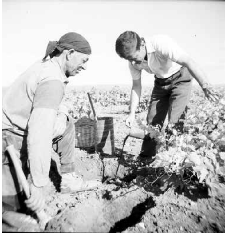
5. A. Belda (1967), Corrección de clorosis en una cepa, Villarrobledo (7000-sea-Albacete Mediateca. S.G.T-MAPA)

El Catálogo de Documentales Cinematográficos Agrarios incluye 563 documentales relacionados con la agricultura, pesca, ganadería, alimentación, medio ambiente y sector forestal, habiendo sido producidos la mayoría por el propio Ministerio y distintos Organismos dependientes del mismo (Instituto Nacional de Colonización, Instituto de Reforma Agraria, Servicio Nacional de Concentración Parcelaria, Servicio Nacional del Cultivo y Fermentación del Tabaco, Servicio Nacional de Caza y Pesca, Servicio Nacional del Trigo, Servicio de Plagas Forestales Servicio Agronómico, Servicio de Extensión Agraria, Instituto Nacional de Reforma y Desarrollo Agrario, Instituto Nacional de Conservación de la Naturaleza e Instituto Nacional de Investigaciones Agrarias) (CAMARERO RIOJA, 2014).