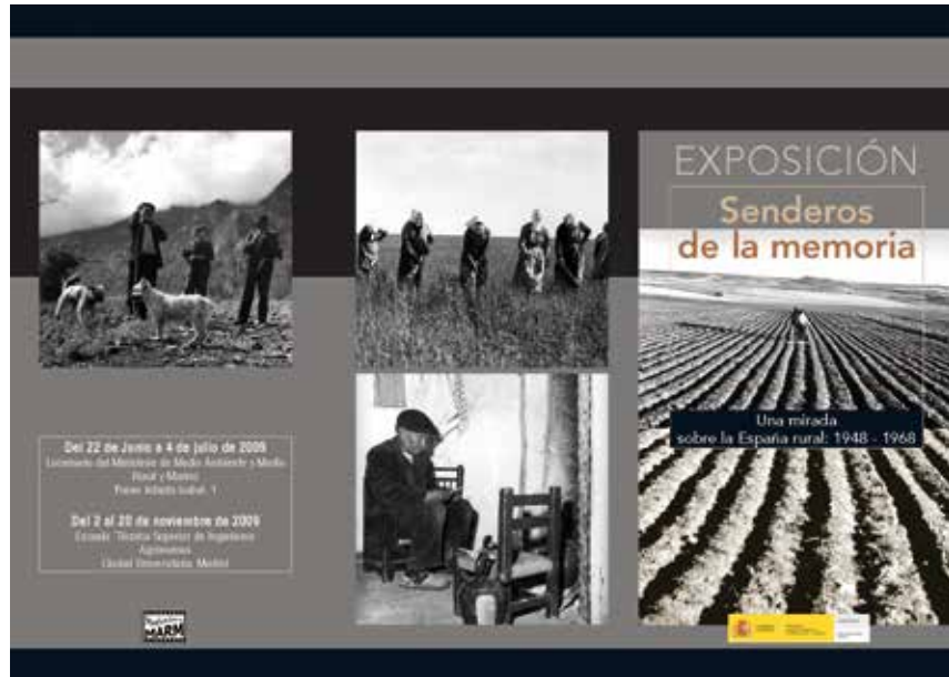
9. Tríptico informativo Exposición Senderos de la memoria

En resumen, a través de los trabajos comentados sintéticamente en este artículo, se ha conseguido recuperar, poner en valor y facilitar la reutilización con fines de formación e investigación de un patrimonio fotográfico y cinematográfico histórico producido por el Ministerio de Agricultura que se considera de especial interés en nuestra actual sociedad de la imagen.