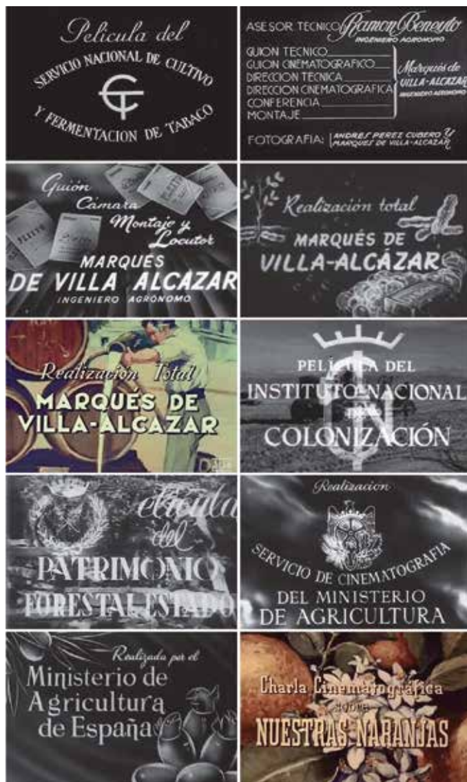
6. Fotocomposición con fotogramas de alguno de sus documentales

mental cinematográfica propia del Ministerio de Agricultura.