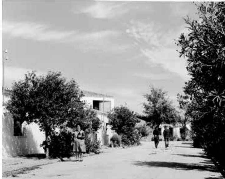
4. Calle de Talavera la Nueva (ca.1960)

La temática que abarca el fondo fotográfico del INC conservado en el MAPA no se limita a imágenes sobre arquitectura o arte sacro de los pueblos de colonización, sino que también abundan las instantáneas que reflejan la vida cotidiana de los colonos (Fig. 4). La mayoría de las fotos están realizadas por personal del propio INC, pero cabe destacar que muchas de ellas están realizadas por el ya mencionado Kindel, fotógrafo de gran prestigio profesional. También hay que destacar las fotos aéreas, encargadas por el MAPA a empresas como Paisajes Españoles o Foat S.L., con las que se conseguían vistas aéreas de las nuevas poblaciones, apreciándose especialmente el trazado urbano, siempre renovador y adaptado a las necesidades de los colonos y de la labor agrícola a desarrollar.