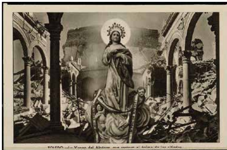
5. Bloc postal Toledo , Fotografía Rodríguez, Huecograbado Fournier, 1948. Archivo Municipal de Toledo

También hacia 1950, Huecograbado Fournier editó numerosas tarjetas postales de otros enclaves toledanos, con imágenes de la casa Rodríguez. Se trata de un momento clave en los años de la dictadura: se deja atrás el elemento bélico y se dan a conocer otras instantáneas que muestran joyas arquitectónicas y aspectos