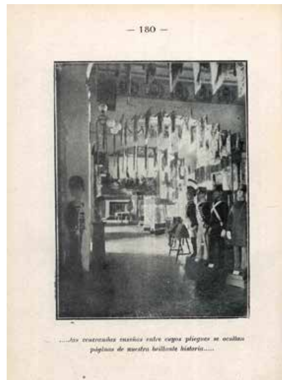
6. "Museo de Infantería". Guía de Toledo. Publicación Oficial del VII Centenario de la Catedral , 1926.

En su interior, se ofrecen datos prácticos: pernocta, transporte, comercios de productos artesanos y casas de fotografía para adquirir tarjetas y publicaciones sobre la ciudad, entre las que nombra al negocio Rodríguez. La guía breve no indica la autoría de las imágenes del itinerario, a diferencia de la publicación del centenario que sí lo hace al final de cada capítulo. Al comparar las tomas en las dos obras, la revista de la que proceden y otros materiales contemporáneos, se ha certificado que corresponden a Rodríguez las imágenes de la Casa-Museo del Greco, los cuadros del cretense, el tesoro de la Catedral y su imaginería, vistas generales de parroquias, salas de los museos arqueológico y de infantería, el Alcázar y sus inmediaciones.