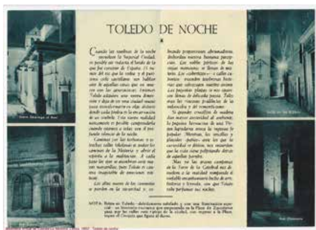
3. Toledo de noche. [1950]. Junta Provincial de Turismo. Centro de Estudios de Castilla-La Mancha

Santa María la Blanca, el claustro de San Juan de los Reyes, la Catedral, la puerta de Bisagra, el Baño de la Cava y la iglesia del Cristo de la luz. El folleto reúne el trabajo de autores de gran trayectoria como Wunderlich, Moreno, Andrada y Ruiz Vernacci, junto al de Rodríguez, menos reconocido, al que pertenece la estética toma del Baño de la Cava que, como se verá más adelante, se reproduce en diferentes momentos del siglo. Estas fotografías posiblemente no fueron realizadas ex profeso para ilustrar una publicación turística, pero la representación de España y, en este caso, de Toledo en concreto, se correspondía con la intencionalidad propagandística: la ciudad de las tres culturas, representadas por los tres templos principales: mezquita, catedral, sinagoga; la ciudad de los Reyes Católicos, como manifiesta el claustro de San Juan de los Reyes; la imperial, con la puerta de Bisagra y la bañada por el Tajo, como transmite la toma del Baño de la Cava.