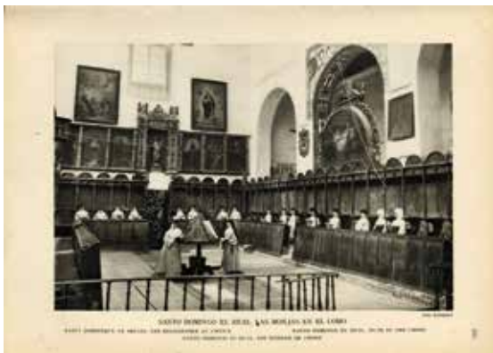
7. "Santo Domingo el Real. Las monjas en el coro", Fotografía Rodríguez. Toledo, Patronato Nacional de Turismo [1930]. Centro de Estudios de Castilla-La Mancha

interpretaciones: el Toledo pintoresco, por sus paisajes; el artístico y monumental, por sus arquitecturas, museos y tesoros; y el histórico y tradicional, por sus personajes y tradiciones.