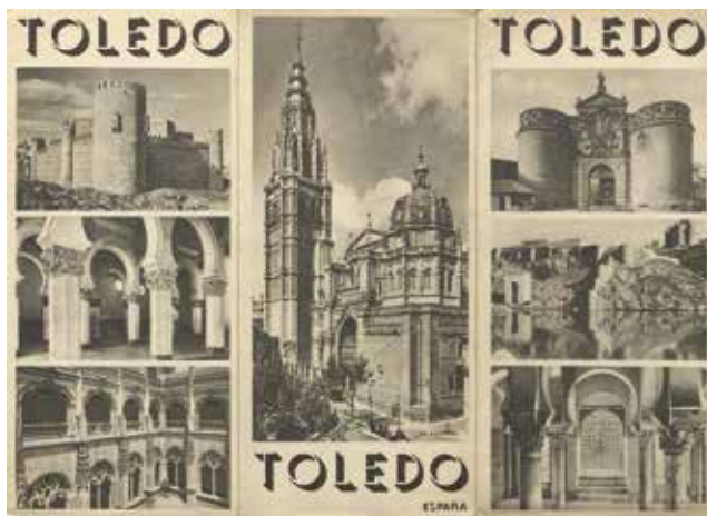
2. Toledo. España, [1940-1950]