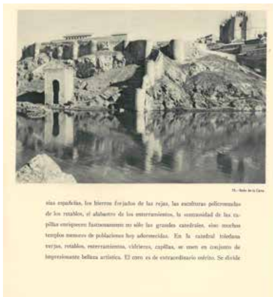
8. "El Baño de la Cava", Toledo, Rafael Calleja, Dirección General de Turismo, [1939-1951].

Por tanto, se tratan de imágenes con una amplia trayectoria en el siglo XX debido a su vigencia. La historiografía sobre fotografía no alude a los trabajos de los fotógrafos que fueron utilizados en las publicaciones turísticas. En este caso, es una saga familiar que compatibilizó la fotografía de estudio, los reportajes de carácter político-social y las fotografías enfocadas a satisfacer las demandas de los turistas que visitaban la ciudad. Por lo cual, es evidente que en los sucesivos proyectos de los Rodríguez hubo un interés por desarrollar tomas de naturaleza turística.