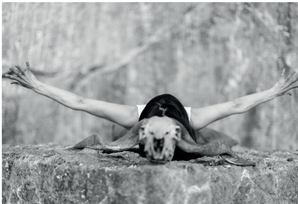
“Refugios: Geografía de la creación”. Davinia Fillol.