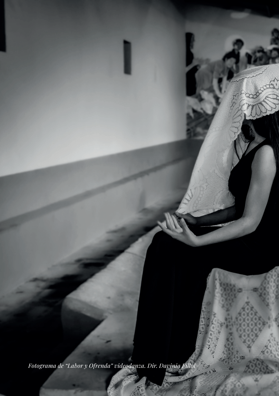
Fotograma de "Labor y Ofrenda" videodanza. Dir. Davinia Fillol