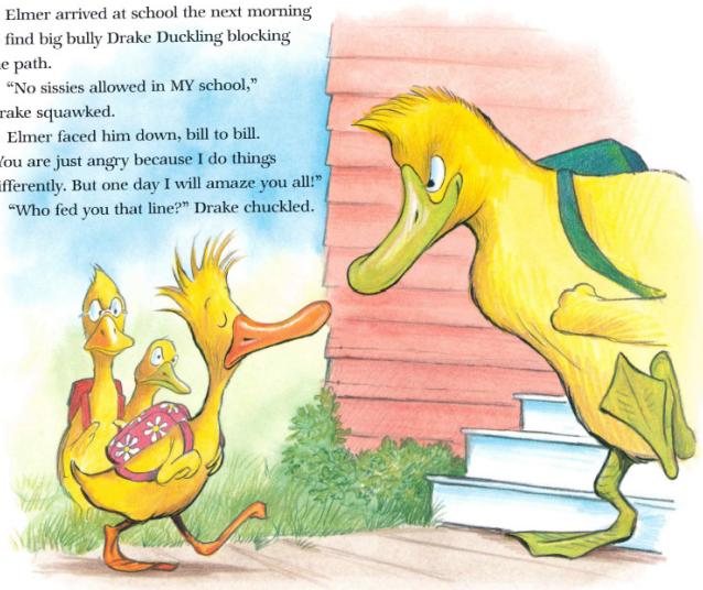
Figura 1. Séptima ilustración de The Sissy Duckling (2002). © Henry Cole.

"Who fed you that line?" Drake chuckled.