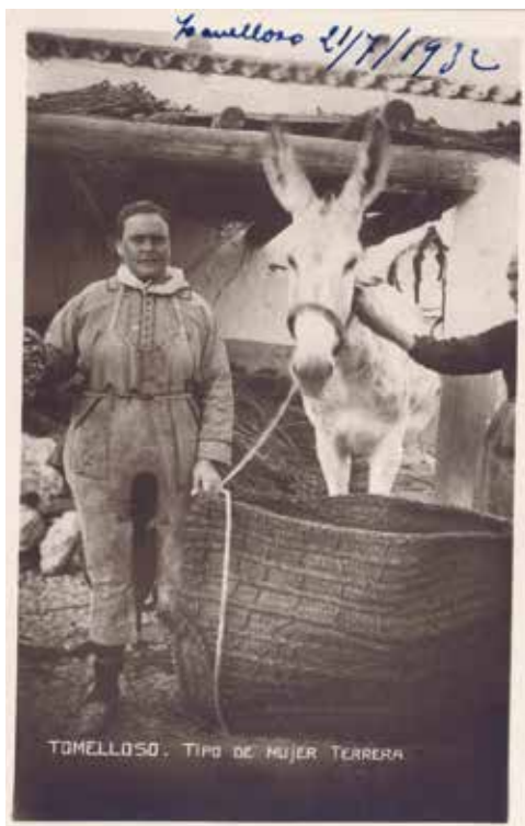
11. Terreras y asno. Tomelloso. Ha 1932

Para nuestro análisis vamos a distinguir entre el retrato que nace con voluntad de permanecer en el ámbito privado (aunque luego las instituciones de la memoria lo hagamos público) de aquel otro concebido para su difusión. El fenómeno del coleccionismo ha sido más bien tardío en nuestro país 47 . En realidad, buena parte de nuestros fondos y de muchas fototecas están constituidos por tomas privadas que documentan rituales de paso: bautizos, comuniones, bodas y entierros. El abaratamiento de la fotografía permitió el acceso progresivo a ella de amplias capas sociales, aunque solo fuera en esos momentos trascendentes del ciclo vital 48 . De ahí, su enorme abundancia 49 .