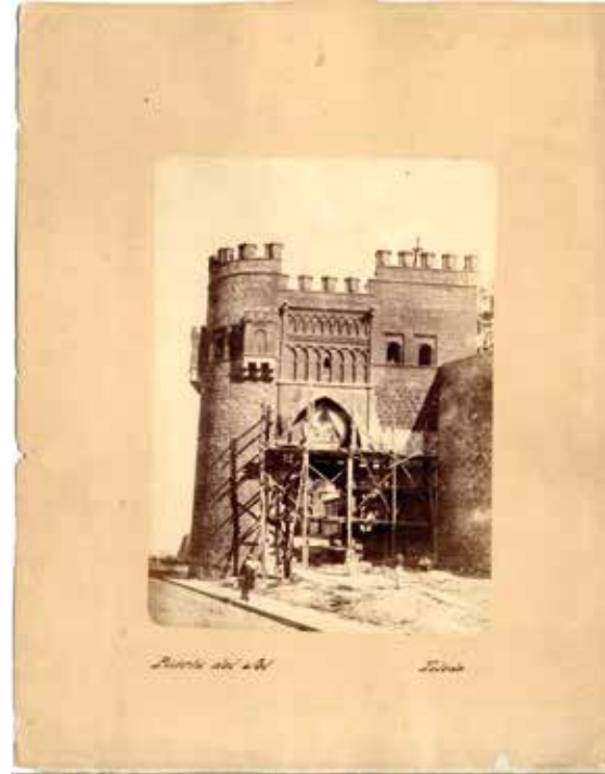
3. Puerta del Sol de Toledo. Ha.1867

Fuera de aquella primera vista quedó uno de los monumentos más emblemáticos de la ciudad, la Puerta del Sol, fotografiada en cientos de registros, uno de los cuales es la figura 3 de este texto. Se trata de una copia de época en papel albuminado sobre soporte de cartón que