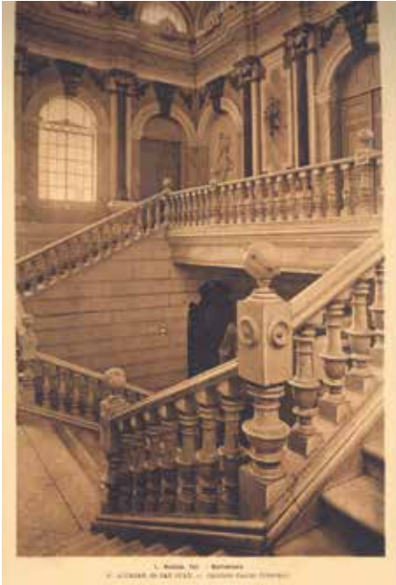
4 a. Casino principal de Alcázar de San Juan. Hueco de la escalera