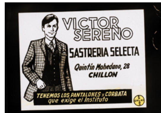
2. Negativo de un vidrio de Esteban Salas