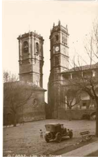
4 b. Alcaraz, las dos Torres

aparecen anotaciones que se explican en el propio mensaje 19 . Intervenciones de este tipo sobre soportes fotográficos son bastante habituales y amplían su valor documental. Desde los años sesenta del siglo XX el edificio empezó a sufrir los efectos de la falta de mantenimiento en un nuevo contexto urbano marcado por el desarrollismo franquista 20 .