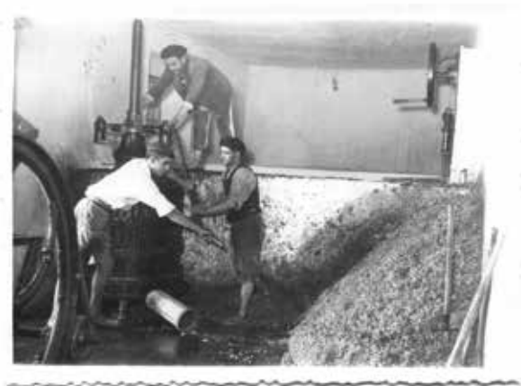
7. Núñez fotógrafo, Prensando la uva , Ciudad Real. Años 50

La cosecha y procesamiento de los cereales se llevaba a cabo gracias a segadores, trilladores y aventadores. Se puede ver bien en la figura 8, en la que a un lado del convento de los Dominicos de Almagro se encuentra la era en la que se estaba trillando.