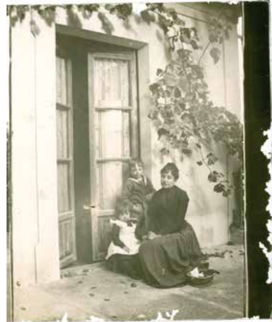
1. Negativo de un vidrio de Eduardo Matos

No podemos omitir los soportes de cartón para albúminas con variado nivel de complejidad ornamental, ni tampoco algunos cianotipos y procedimientos fotomecánicos poco habituales como el woodburytipo 11 . Aunque si nos referimos a fotomecánica es imposible obviar la tarjeta postal 12 . El Centro tiene una nutrida colección de