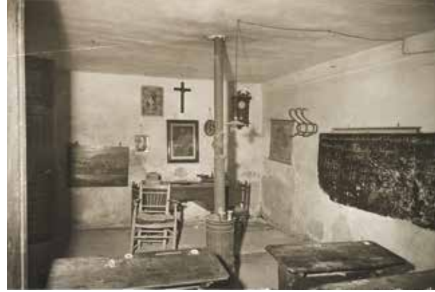
6. Escuela de Noheda. 1956

siglo XX. Así lo podemos comprobar en una de las fotos que tomó el inspector provincial de Enseñanza de Cuenca en la escuela de Noheda en 1956 (figura 6) 25 . Con el repertorio gráfico que custodiamos podría hacerse una historia de la arquitectura educativa del siglo XX en España, dado que se definieron tipologías comunes a todo el territorio nacional. Así, a partir de estas fotografías castellanomanchegas identificaríamos escuelas levantadas a muchos kilómetros de distancia.