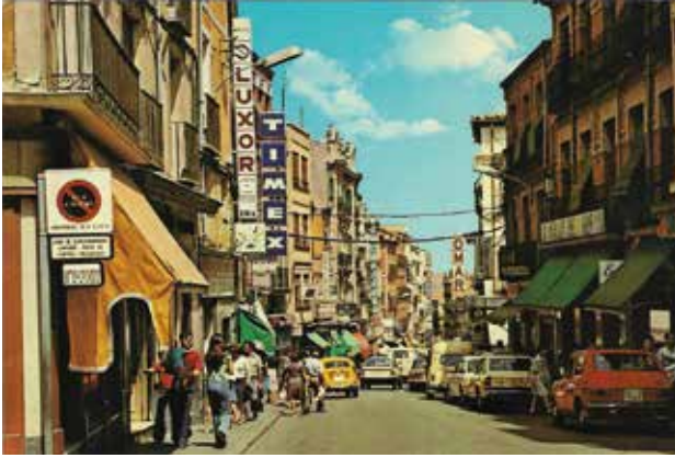
5. Guadalajara. Calle Miguel Fluiters. 1978