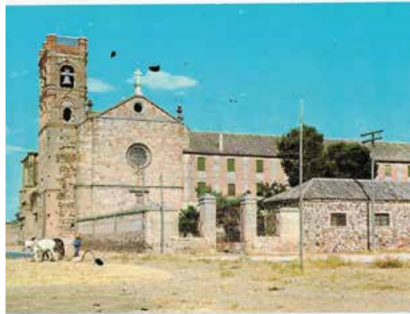
8. Trilla de Almagro . 1966