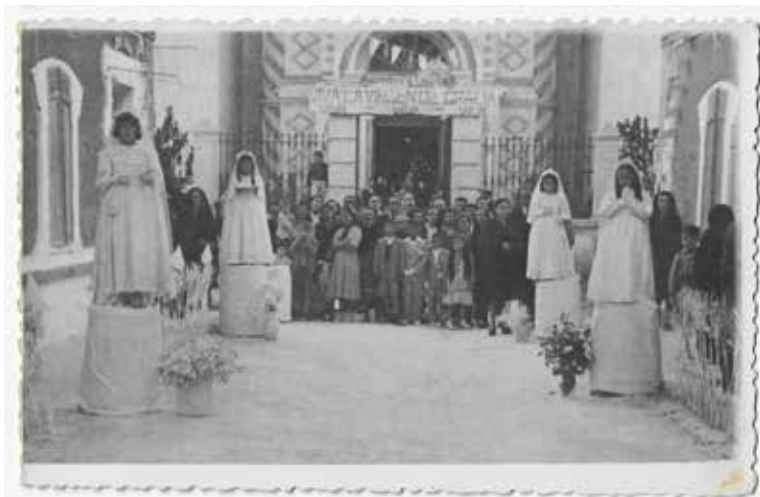
10. Corpus de Caudete . 1952

Precisamente la celebración festividades en torno a las patronas y patronos de los pueblos es uno de los elementos del patrimonio inmaterial que de manera reiterada se ha reproducido en diversos soportes fotográficos, muchos de los cuales están en la colección del Centro de Estudios. Constituían un hito en el ciclo anual de las gentes, un momento excepcional de descanso en la actividad agraria y de sociabilidad intergeneracional, amén de una suerte de reafirmación de la identidad local. Entre estos festejos tienen especial desarrollo los vinculados al santoral protector del campo: san Antón, san Blas o san Isidro, por ejemplo, que conllevan, además de los actos estrictamente religiosos, otros de carácter sincrético como las hogueras o las propias romerías 42 .