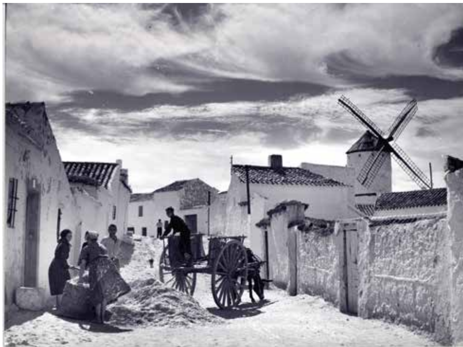
9. Isidro de la Heras, Carro de Campo de Criptana . 1962

Sin lugar a dudas, una magnífica síntesis de la cultura popular, material e inmaterial, en una España que todavía no ha vivido el impacto desarrollista de la mecanización agraria (1966). Y de la era al molino. El repertorio fotográfico de esta arquitectura preindustrial es casi infinito por su conexión literaria con el Quijote. Traemos hasta aquí una impresionante registro de Isidro de las Heras, tomado en el albaicín de Campo de Criptana (1962); se puede apreciar el trabajo de trasiego de la paja realizado por un grupo de campesinas, con el sempiterno molino en el horizonte. Además, la imagen sirve para documentar la arquitectura vernácula, puesto que se percibe perfectamente los paramentos murales de viviendas, sus puertas de acceso y las techumbres. Por otra parte, la belleza plástica y perfección compositiva remite a lo mejor de la fotografía española de aquellas décadas, desde Muller a Masats (figura 9).