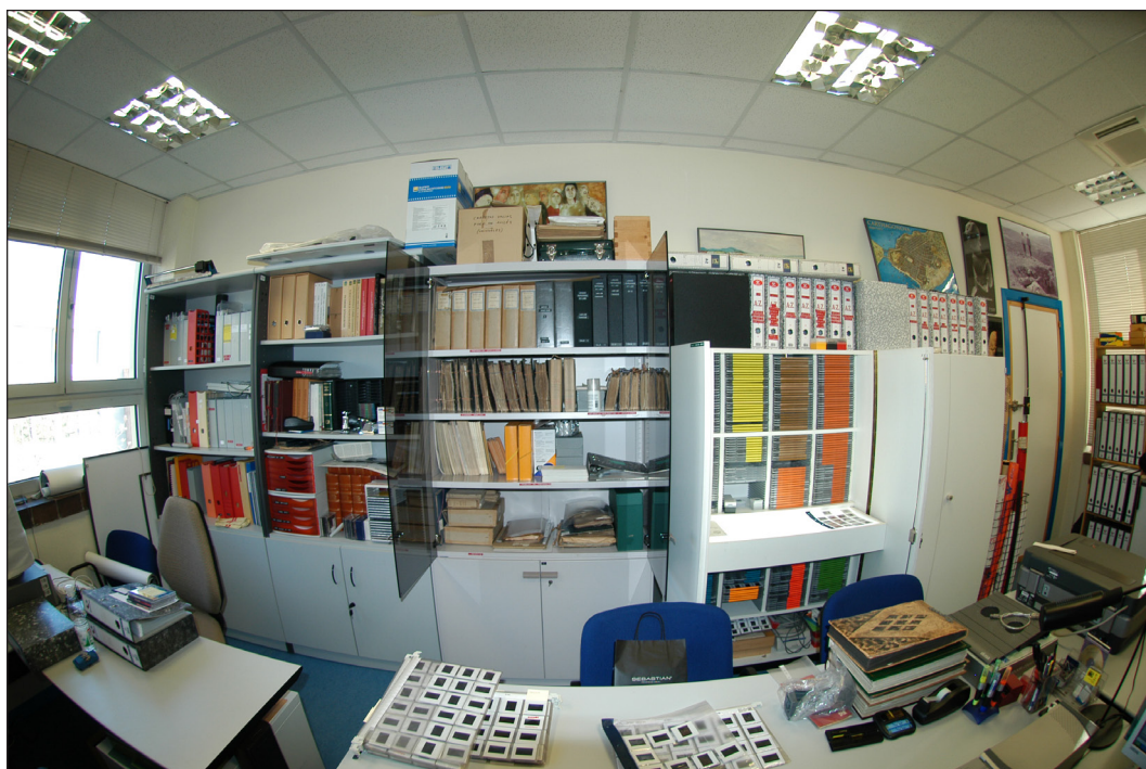
Fig. 1. Centro Documental de Arqueología y Patrimonio (CeDAP de la UAM). ©J. Blánquez (2007)

Nuestro proyecto de innovación docente se acometió dentro de los trabajos llevados a cabo desde el CeDAP de la UAM (Fig. 1) (Blánquez et alii. , 2018). Este Centro, creado en 2014, surgió a partir de una línea de investigación, pionera en el ámbito universitario español, centrada en los estudios historiográficos de la arqueología española. Esta línea comenzó su andadura en 1998, cuando se creó un Gabinete de Investigación , en la facultad de Filosofía y Letras de la UAM, para el estudio de la historia de la Arqueología española a través de legados documentales pertenecientes a arqueólogos españoles del pasado siglo xx, mostrando especial atención al análisis de sus imágenes fotográficas.