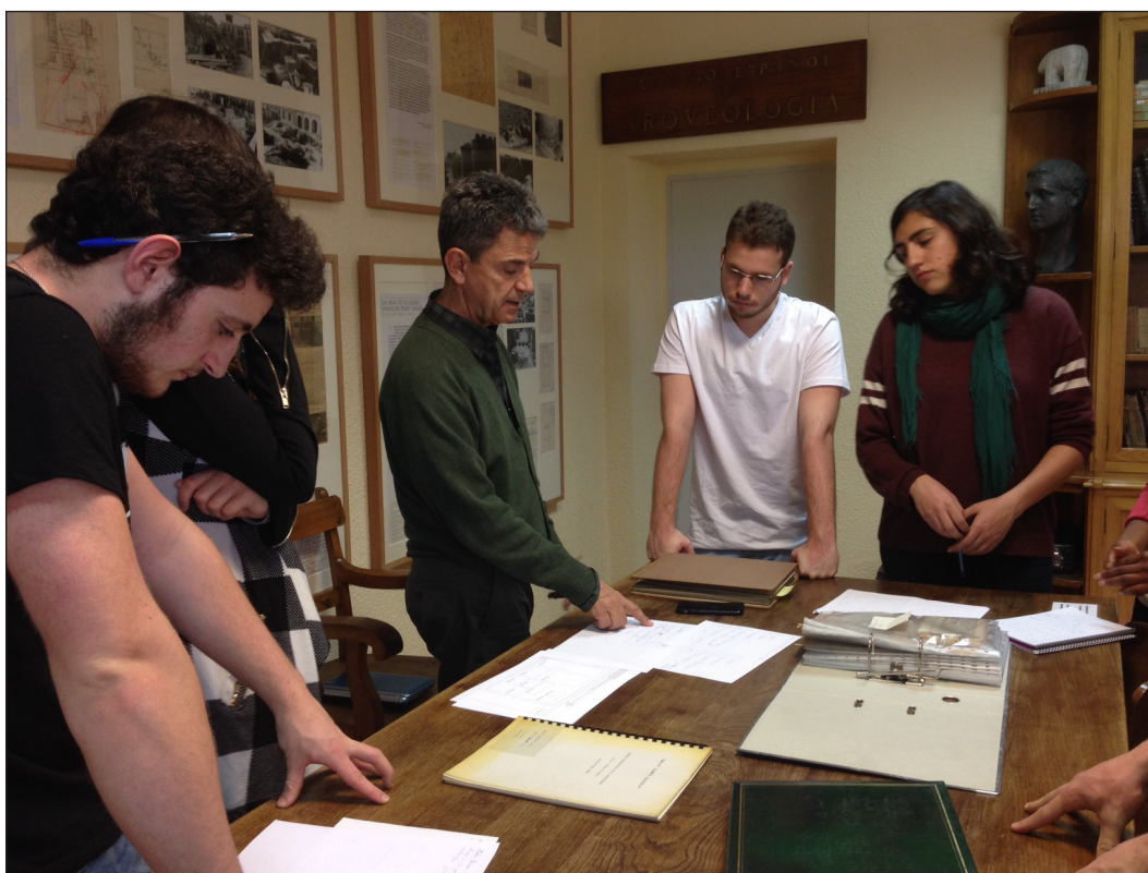
Fig. 5. Alumnado de Grado y Máster durante las tareas acometidas en el proyecto de innovación docente.

era el planteado resultante de la composición de los textos y los documentos fotográficos en los respectivos cuadros expositivos.