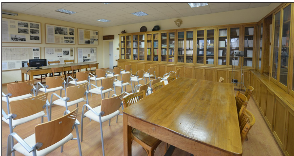
Fig. 2. Aula Historicista del dpto. de Prehistoria y Arqueología. Facultad de Filosofía y Letras, Universidad Autónoma de Madrid (UAM).