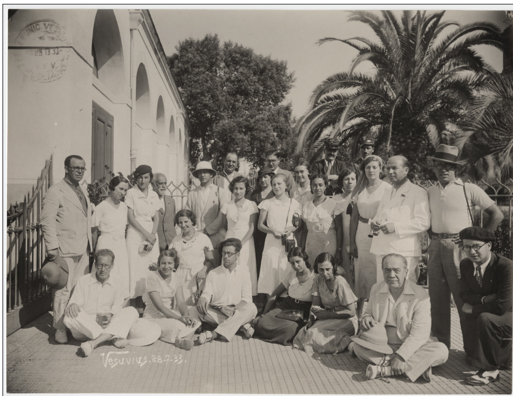
Fig. 4. Un grupo de «cruceistas», con sus profesores, en la estación del funicular del Vesubio (28 de julio de 1933). © CeDAP de la UAM. Legado documental familia Cabré , Álbum 3, nº Inv. 792

resultados -la propia inauguración de la exposición- al finalizar el curso académico. Así, pues, las tareas a tratar en este proyecto de innovación docente, a través de la participación directa del alumnado, fueron: