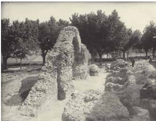
1. Excavación arqueológica en el Circo romano, h. 1928. Positivo sobre papel de revelado químico formato postal, 85 x 113 mm. Colección LAR-137

Otras grandes iniciativas relacionadas con el patrimonio y la cultura también contaron con un espacio en las publicaciones. Por ejemplo, hay fotografías para informar de la fundación de la Casa del Greco (ANÓNIMO, 21 de mayo de 1910: 325) o de los trabajos en la Sinagoga del Tránsito para establecer un Centro de Estudios Hebraicos y Arabistas (ANÓNIMO, 9 de diciembre de 1911: 772). La fuerza de la imagen en la prensa también fue un vehículo para la difusión de iniciativas particulares de tipo cultural, como un proyecto para homenajear a Garcilaso de la Vega (CAMARASA, 1928b: 1975-1978; 18 de marzo de 1928: 13; 22 de agosto de 1930: 8).