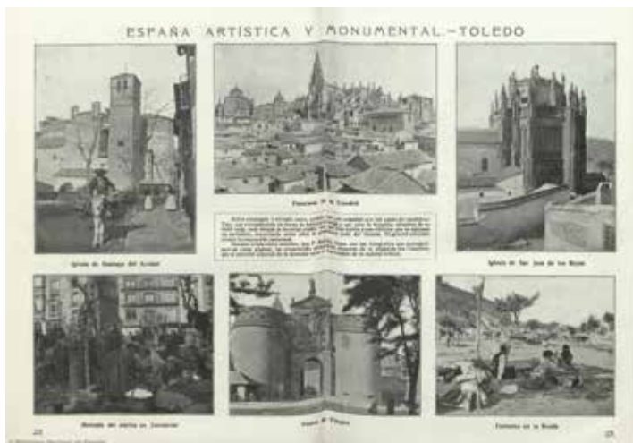
9. Fotografías de Pedro Román en la sección "España artística y monumental: Toledo". La Hormiga de Oro , 16, 20 de abril de 1918, pp. 174-175

relacionadas con el fenómeno del turismo, incorporaron una renovada iconografía de las ciudades. Este soporte proporcionaba la posibilidad de enviar un mensaje o de guardar un recuerdo del lugar visitado.