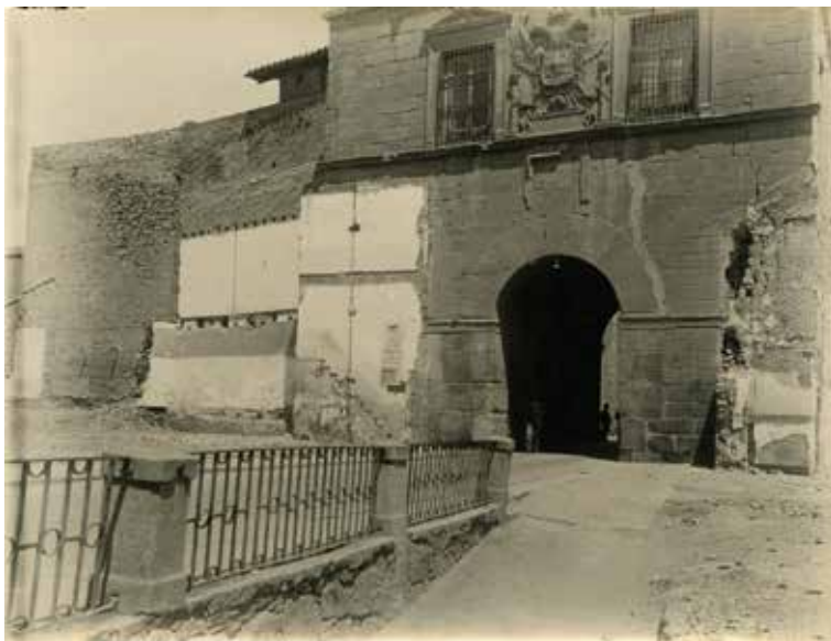
5. Fachada interior de la puerta de Bisagra durante el derribo de las casas adyacentes, h. 1934. Positivo sobre papel de revelado químico, 112 x 86 mm. Colección LAR-623. Publicada en P. Román, (1934). "El aislamiento de la Puerta de Bisagra" en Boletín de la Real Academia de Bellas Artes y Ciencias Históricas de Toledo , 55, lámina 3. a

con un objetivo funcional, el ensanchamiento de la calle para resolver el problema de la circulación, y otro más estético, el aislamiento del monumento a la manera de otras puertas monumentales exentas. Pese a no secundar estos trabajos, la restauración permitió al fotógrafo el examen de la primitiva estructura islámica, de modo que pudo confirmar sus hipótesis trazadas en investigaciones pasadas (ROMÁN MARTÍNEZ, 1934: 103-107).