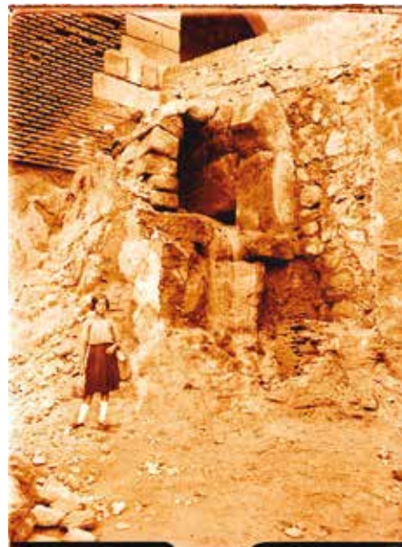
4. Galería romana descubierta en la Puerta de Valmardón, 1932. Publicada en "Descubrimiento de una galería romana en la puerta de Valmardón. Nota leída en la sesión del 6 de noviembre de 1932", Boletín de la Real Academia de Bellas Artes y Ciencias Históricas de Toledo , 52-53 (1932), pp. 67-69

Por la envergadura de la intervención y por la relevancia del espacio, merece la pena destacar las obras en la Puerta de Bisagra: se derribaron las casas adyacentes