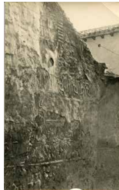
7. Restos de esgrafiados frente a Santa Úrsula, h. 1935. Positivo sobre papel de revelado químico, 88 x 55 mm. Colección LAR-801. Publicada en P. Román (1935), “Fachadas toledanas con esgrafiados” en Boletín de la Real Academia de Bellas Artes y Ciencias Históricas de Toledo , 56, lámina III

Vemos que se sigue edificando con la misma libertad de antes y con más prisa para tener pronto la casa concluida, así como también con el permiso municipal, previo el favorable informe de la Comisión edilicia, que unánimemente lo aprueba todo, a veces contra lo que dicen los técnicos y siempre con el voto contrario del artista Sr. Román, que se queda solo, lo que por su propio orgullo queremos propagar en estas cuartillas” (CAMARASA, 20 de mayo de 1927: 38).