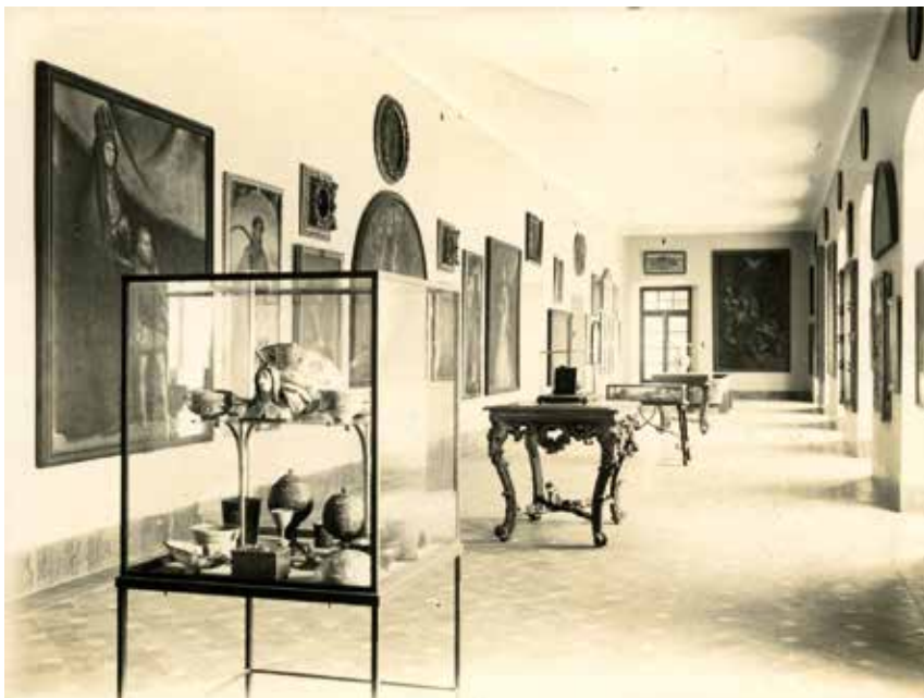
2. Museo Arqueológico Provincial de Toledo: Sala de Pintura, 1936. Positivo sobre papel de revelado químico, 90 x 111 mm. Colección LAR-688. Publicada en P. Román, (16 de enero de 1936). "El nuevo Museo Arqueológico Provincial de Toledo", La Hormiga de Oro , 3, p. 57