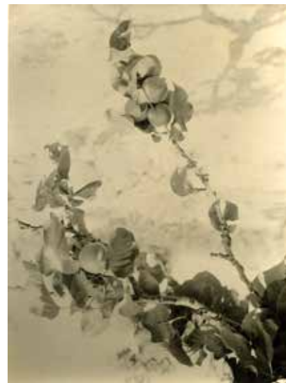
10. Rama de albaricoquero cargado de fruto, h. 1923. Positivo sobre papel de revelado químico, 114 x 85 mm. Colección LAR-673. Publicado en A. González-Blanco, "Por tierras de Toledo. La poesía del albaricoque", Nuevo Mundo , 1538, 13 de julio de 1923, p. 28

La fotografía de autores aficionados españoles alcanzó una calidad notable desde los comienzos del siglo XX. Indudablemente, un ejemplo es la obra de Pedro Román, que esta investigación ha abordado. Tras revisar su biografía, cabe subrayar que su formación académica en Bellas Artes, el contacto con artistas de prestigio y la sensibilidad por el patrimonio fueron esenciales para emplear la fotografía documental como un instrumento para la conservación de los bienes. También asumió cargos de responsabilidad en organismos públicos e instituciones culturales, como la Real Academia de Bellas Artes y Ciencias Históricas de Toledo, la Comisión Provincial de Monumentos o el Ayuntamiento de Toledo.