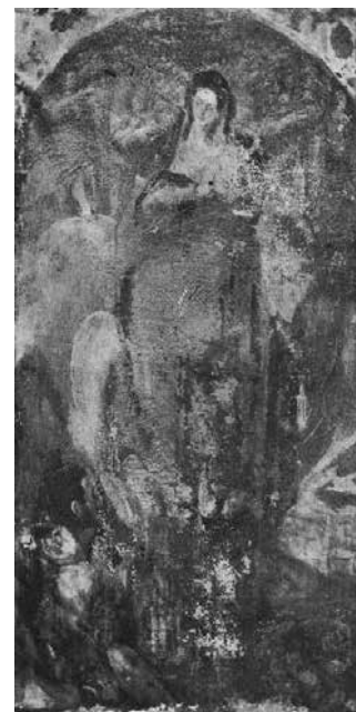
3. "Inmaculada Concepción contemplada por san Juan Evangelista", del Greco tras su hallazgo en la iglesia de San Román, Publicada en "Hallazgo de una obra de arte en Toledo". La Hormiga de Oro , 48 (28 de noviembre de 1908), p. 755

Los cambios en cuestiones de museografía también fueron visibles por las imágenes publicadas. Como ejemplos, véanse: la instalación en una vitrina de la armadura de Duarte de Almeida, que antes estaba colgada de las bóvedas de la capilla de Reyes Nuevos (ANÓNIMO, 14 de junio de 1913: 382); la inauguración del Museo Romero Ortiz en el Alcázar, donde las imágenes traducen la disposición de los objetos en sala, (GONZÁLEZ, 1922a: 400-410; 1922b: 422-423); o el Museo Arqueológico Provincial, cuya apertura en el Hospital de Santa Cruz fue documentada con