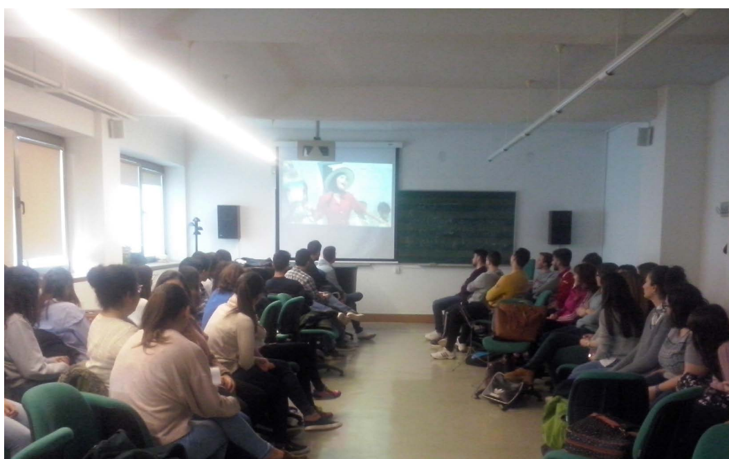
Figura 3. Actividad 3 “El sonido de don Quijote”, Sesión 1.

El punto de partida de esta experiencia iba destinado a recuperar un testimonio musical popularizado a través de los medios audiovisuales y a diseñar, en torno a éste, una propuesta didáctica para alumnos universitarios. Mientras que las actividades de la Sesión 1 fueron encaminadas a la sensibilización musical y al conocimiento del contexto de “Don Quijote” –la presencia de la música en el cine, el acercamiento a las músicas populares urbanas de los años sesenta en España, el desarrollo de la escucha intelectual y la aproximación al contexto en que la canción nació se popularizó gracias al cine–, las Sesiones 2 y 3 fueron dirigidas a convertir al alumno en el protagonista de su propio aprendizaje de una forma práctica y activa a través de la interpretación y experimentación musical.