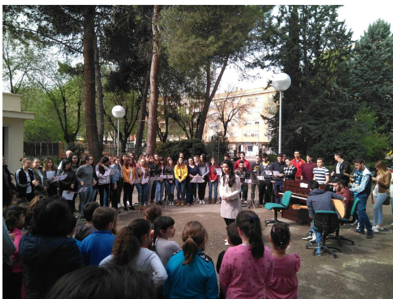
Figura 4. Fotografía del recital músico-literario desarrollado en la Actividad 10.

Los participantes en la experiencia didáctica no solo fueron protagonistas de la divulgación de un testimonio de la historia de la música en los medios audiovisuales, como “Don Quijote”, de Algueró, ante sus compañeros del centro y un público infantil, sino que también protagonizaron la interpretación de otros testimonios musicales y literarios. Los futuros maestros recibieron los aplausos de los asistentes y los alumnos de 2º de Primaria reprodujeron ambas canciones de camino de regreso a su colegio, según el testimonio de las profesoras. A pesar de que esta actividad 10, consistente en el recital, resultó la más vistosa de toda la propuesta, todas las acciones previas fueron igualmente necesarias para el correcto desarrollo de ésta última y para la adquisición de los objetivos previstos en toda la experiencia.