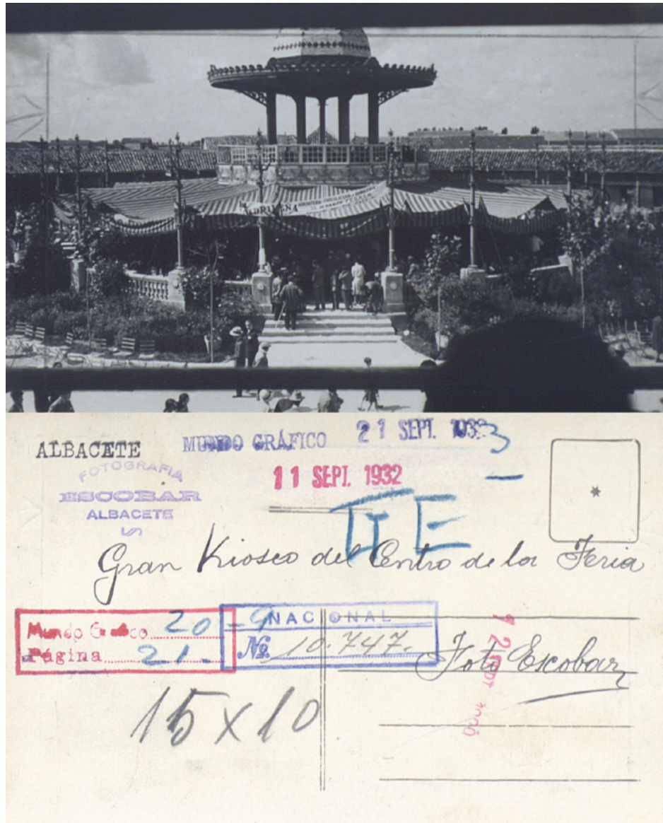
Figura 5. Gran Kiosco del Centro de la Feria. Albacete, 1932