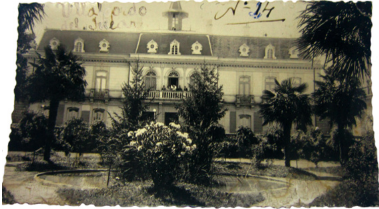
Figura 9. Fachada del Palacio de los Gosálvez en Puente de Don Juan-Villalgorido del Júcar. 1928