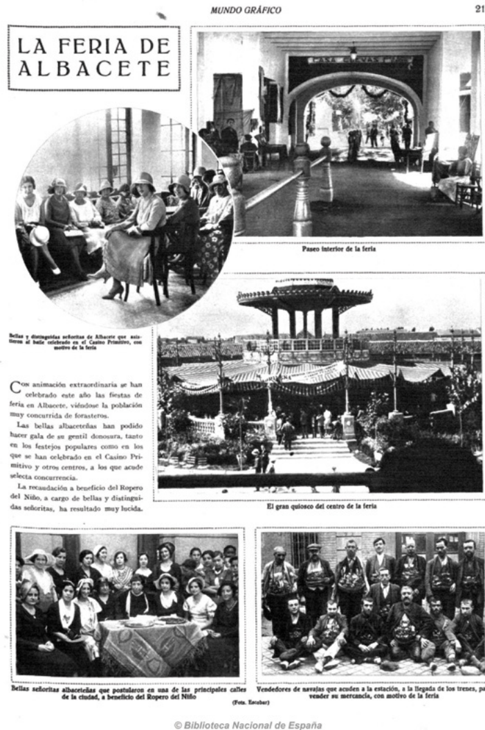
Figura 6. "La Feria de Albacete", Mundo Gráfico , 21 de septiembre de 1932