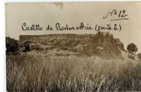
Figura 7. Castillo de Rochafriada, en el término de Ossa de Montiel (Albacete). 1925