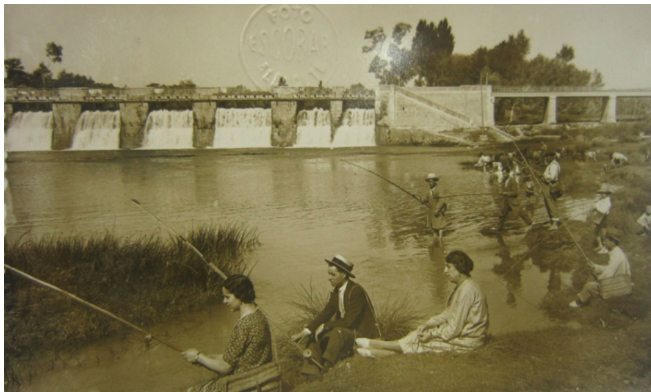
Figura 8. El Puente de Don Juan sobre el río Júcar. Villalgordo del Júcar (Albacete). 1928

En los trabajos de Luis Escobar podemos ver una voluntad clara de realizar reportajes gráficos fuera de los encargos. Sobre todo, fotografías que posteriormente enviaba a la prensa tanto local como nacional. Colaboró esporádicamente como corresponsal con los periódicos Blanco y Negro , El Defensor de Albacete , Mundo Gráfico , La Semana Gráfica y La Unión Ilustrada de Málaga, entre otros.