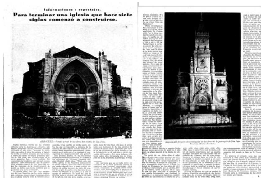
Figura 3. Maqueta del proyecto de fachada de la iglesia de san Juan de Albacete. ABC , 11 de noviembre de 1932

En Ossa de Montiel 19 realizó un recorrido aprovechando su visita a las fiestas patronales. Estas fotografías inéditas son las que ayudan a aproximarnos a la fiso-