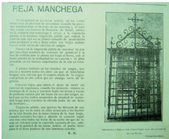
Figura 2. Reja en la calle de La Virgen de La Roda (Albacete). Centauro , 30 de agosto de 1924

De estas fechas fue el reportaje del río Júcar en los pintorescos lugares de Alcalá del Júcar y Jorquera 10 . Al ser una zona de la Manchuela albacetense bastante abrupta e impresionante eran fotografías que los visitantes a Albacete adquirirían. En la revista Centauro salió publicada una panorámica de Jorquera (Albacete) 11 .