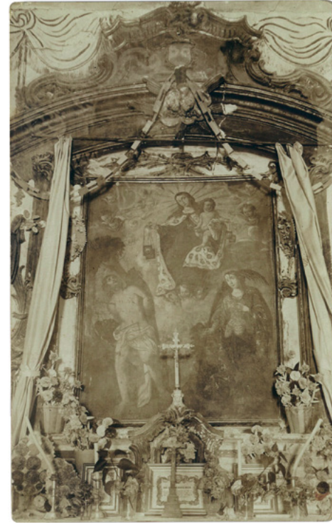
Figura 10. Retablo de la Virgen del Carmen. El Carmen (Cuenca), 1928