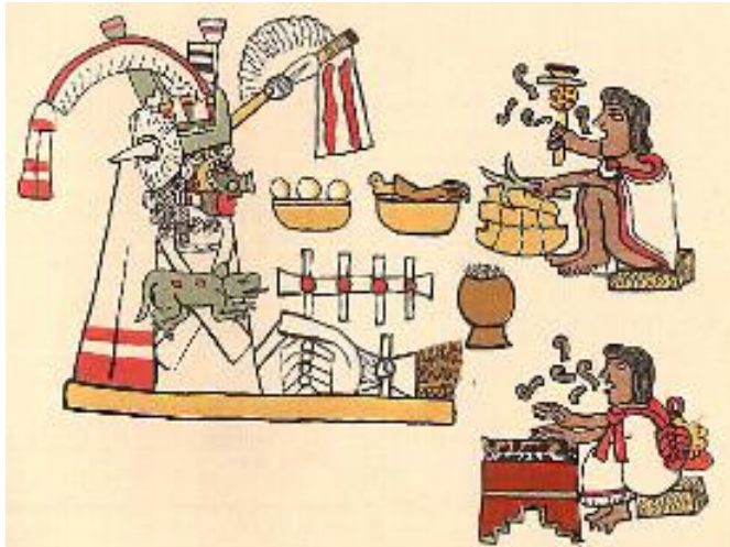
Imagen 3. Chalchiutlicue. Diosa de la lluvia

gracias a los cronistas hispanos han llegado hasta nosotros los ceremoniales incaicos, las fiestas litúrgicas, perfectamente organizadas y donde la música tenía un lugar predominante.