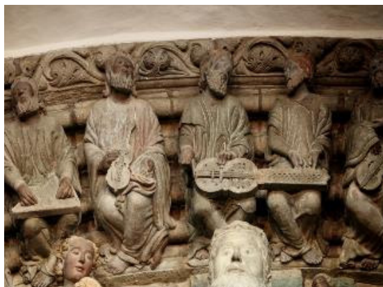
Imagen 1. Detalle del Pórtico de la Gloria. Maestro Mateo

Pero obviamente tenemos que hacer un estudio previo de como la música se convierte en reflejo de la ruptura entre la sociedad alto medieval y la sociedad moderna y humanista que surge a finales del siglo XV.