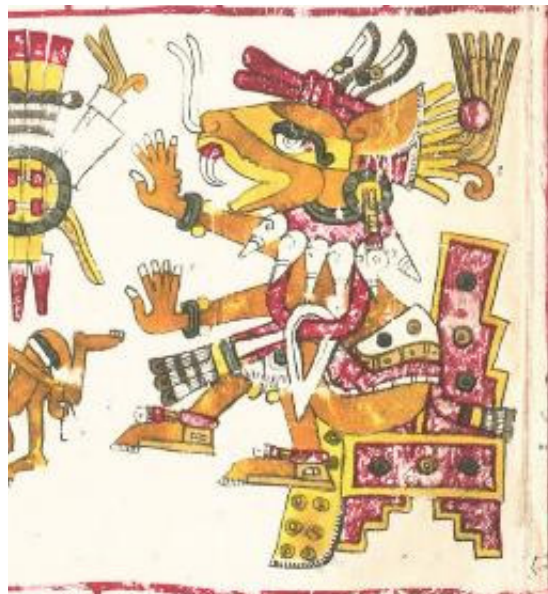
Imagen 4. Ueuecoyotl. Dios de la danza.