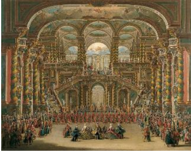
Imagen 5. Fiesta en un palacio barroco. Boceto escenográfico para ópera de Farinelli. Francesco Baltaglioli. Real Academia de Bellas Artes de San Fernando. 1750 1 .

La ópera se convierte de esta manera en la suma de teatro, música y poesía y en la materialización musical del siglo XVII.