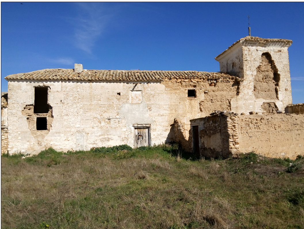
Figura 10. Venta de Borondo. Labores de encalado, 2017. Fotografía digital: Asociación Cultural Venta de Borondo y Patrimonio Manchego