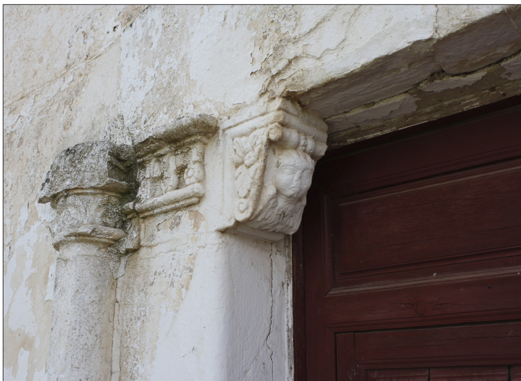
Figura 4. Venta de Borondo, Detalle portada principal, 2012.

En cuanto a los materiales empleados en su construcción indicar que se emplean los propios de la tradición constructiva del entorno. Para los muros se emplea el muro de tapial calicostrado con verdugadas horizontales intermedias de ladrillo entre los cajones de tapial. En las edificaciones anexas el tapial pierde calidad al ejecutarse sin calicostrado y en el caso de la torre-mirador encontramos varios tipos de material: ladrillo, mampostería e incluso adobes. La cubierta se forma mediante sencillas cerchas de madera de par y tirante con varios tipos de tablero: carrizo, tablazón de madera o ladrillo de tejar (de lata). Sobre el faldón inclinado a dos aguas se coloca la teja cerámica curva. Los forjados son de viguetas de madera cuadrada y revoltón de yeso. La rejería y carpintería son muy sencillas aunque destacan algunos herrajes o motivos florales en los remaches de las rejas. Un encalado final cubre todos los muros y solo en capas ocultas encontramos pistas de un zócalo en color almagre. En las carpinterías se emplean también estos pigmentos de color almagre para dar color.