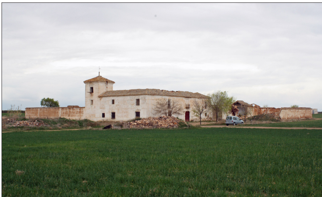
Figura 1. Venta de Borondo. Vista exterior, 2014.

El edificio principal de la venta está formado por una edificación de planta rectangular, dos alturas, patio interior y torreón en la esquina suroeste. Se accede al interior desde una puerta en el alzado este, flanqueada por un pórtico de sillería decorado con basas, medias columnas adosadas al paramento, capitel, friso y escudo de armas en el centro del dintel. Desde el patio central, que es además de distribución, se accede a las estancias interiores (cocinas, cuadras y cuartos). Desde dicho patio se accede también a la planta superior (en su uso de cuartos y cámaras) mediante una escalera interior de dos tramos y otra exterior de un tramo.