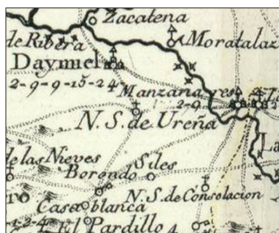
Figura 6. Borondo. Cartografía Tomás López, 1765