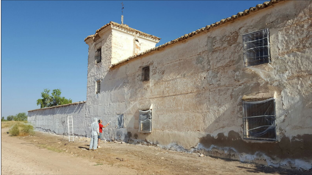
Figura 9. Venta de Borondo. Patologías en Alzado Oeste, 2016.

preocupación social por el futuro del monumento se materializó en julio con la creación de la Asociación Cultural Venta de Borondo y Patrimonio Manchego, asociación de ámbito nacional, cuyos fines son la defensa, divulgación y puesta en valor del patrimonio histórico.