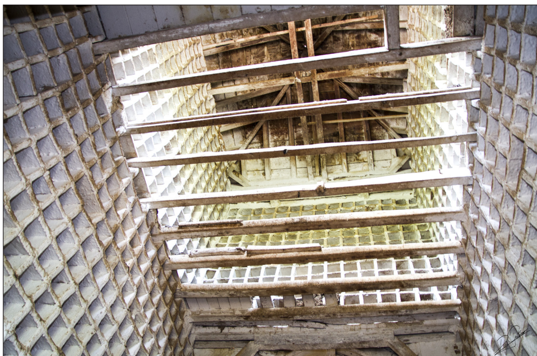
Figura 3. Venta de Borondo. Vista interior del torreón, 2016.

El acceso al torreón, en su uso actual como palomar, tiene lugar a través de una escalera desde las cuadras, mientras que al pajar únicamente se accede a través de un pequeño hueco en el forjado de las cuadras. El torreón pudo emplearse anteriormente como mirador, incluso con cierto carácter defensivo, durante un periodo de gran importancia de la venta para aumentar su visibilidad desde distancias lejanas. Testigo de ello son sus cuatro ventanales cegados y un sistema constructivo diferenciado respecto del conjunto que podría justificar que dicha torre-mirador sea un añadido posterior, posiblemente en torno a los siglos XV-XVI, semejable a los torreones de las casas rurales de la Orden de Calatrava de esta misma época.