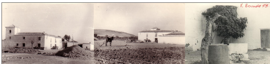
Figura 8. Venta de Borondo. Primeras fotografías, 1953.

En la segunda década del siglo xx aparece una nueva referencia a la Venta de Borondo en la edición cultural Blanco y Negro del diario ABC del 30 de agosto de 1925 tratando los paisajes manchegos y su relación con la obra de Cervantes citando: «...Bolaños, con su venta de Borondo, en la que Don Quijote fue armado caballero» (Dotor, 1925: 49).