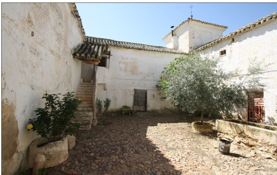
Figura 2. Venta de Borondo. Vista patio interior, 2012.

El edificio principal de la venta está formado por una edificación de planta rectangular, dos alturas, patio interior y torreón en la esquina suroeste. Se accede al interior desde una puerta en el alzado este, flanqueada por un pórtico de sillería decorado con basas, medias columnas adosadas al paramento, capitel, friso y escudo de armas en el centro del dintel. Desde el patio central, que es además de distribución, se accede a las estancias interiores (cocinas, cuadras y cuartos). Desde dicho patio se accede también a la planta superior (en su uso de cuartos y cámaras) mediante una escalera interior de dos tramos y otra exterior de un tramo.