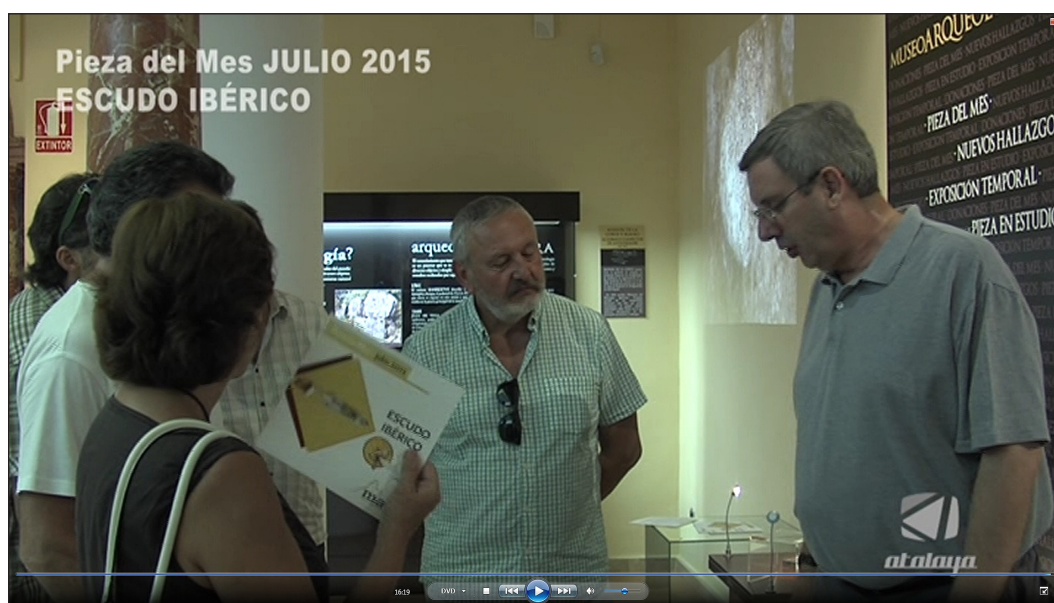
Fig. 6. Pieza del Mes en el Museo de Cabra (2015). Retransmisión por Atalaya Televisión.

Este Plan de Difusión se articula en tres círculos concéntricos de distinto alcance. En un primer nivel, todos los años se han dictado a cargo de diferentes miembros del equipo de investigación, y de manera planificada, conferencias y charlas divulgativas en diferentes sedes 4 , con el objetivo de dar a conocer a personas específicamente interesadas, bien los resultados de las excavaciones anuales, bien algunos de los materiales específicos. Estas charlas han tenido un alcance local (Círculo de la Amistad de Cabra en 2013, Cinestudio Municipal de Cabra en 2015), comarcal (Festival Festum de Almedinilla en 2015 y 2016), regional (‘Miércoles en el Museo’ del Museo Arqueológico de Córdoba en 2016; Instituto de Estudios Jiennenses en 2016; Centro Asociado de la UNED de Córdoba en 2016) o nacional (Tarraco Viva 2015; Asociación Española de Amigos de la Arqueología en 2016).