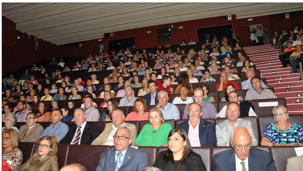
Fig. 9. Gala de entrega de los Premios 'Egabrense del Año' en el Teatro 'El Jardinito' de Cabra, 2015. La mención al Equipo Investigador del Cerro de la Merced fue recogida por una representación del mismo: Dirección, técnicos, voluntarios, trabajadores.

muy diferente 7 . Hoy (2018) es casi obligado que cualquier excavación tenga su página Web en Facebook o un Blog , pero en 2012 era todavía una rareza que se publicara un verdadero 'Diario de excavación' online . Durante los periodos de trabajo de campo, todos los días, se subía a la Red una combinación de breves textos explicativos, fotografías técnicas y fotos de anécdotas de la excavación, sin faltar a nuestra cita un solo día incluso en campañas que duraban siete semanas continuadas. Ese 'Diario online ' se ha ido completando a lo largo