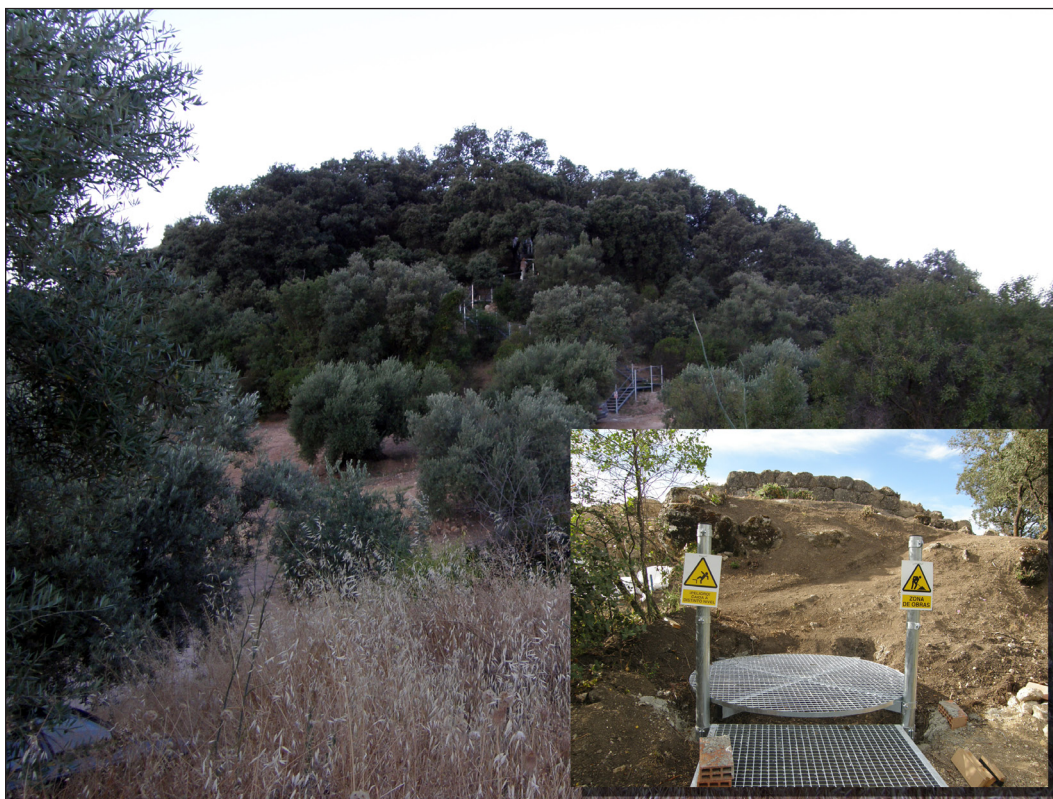
Fig. 5. Hacia la Puesta en Valor como planteamiento integral de la investigación. Construcción de la escalera de acceso a la cima del Cerro de la Merced.

nes investigadores que en estos años vienen realizando sus Trabajos de Fin de Grado (TFG), Trabajos de Fin de Master (TFM) y Tesis Doctorales bajo la cobertura legal e institucional del Proyecto, a menudo bajo contratos. Es así como hasta el momento se ha defendido un TFG, tres TFM y están muy avanzadas dos Tesis Doctorales 2 .