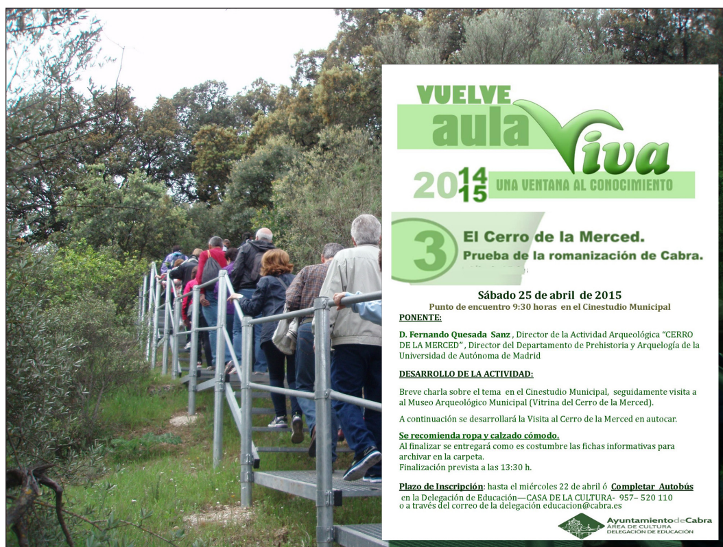
Fig. 7. Divulgación sobre el terreno: Aula Viva en Cabra. Dos autobuses y muchos coches particulares para una visita guiada largamente esperada.

Adicionalmente, en el ámbito egabrense estas actividades se han complementado con otras de carácter más práctico, en particular dentro del programa de 'La Pieza del Mes' en el Museo Arqueológico Municipal de Cabra, (Escudo Ibérico de la Merced en Julio de 2015 6 ; Fíbula Anular Hispánica en Julio de 2017). (Figura 6) Estas actividades, de una modesta media hora de duración, tienen la particularidad de ser además grabadas por la Televisión Local de Cabra, que luego las difunde en su programación. El objetivo de estas 'Piezas', junto con las ruedas de prensa anuales, es de nuevo llegar a un público no necesariamente interesado en la arqueología, pero sí en su pueblo y su comarca.