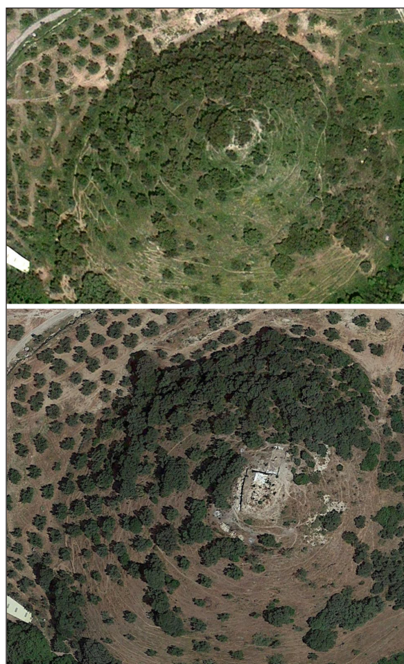
Fig. 2. Cerro de la Merced en 2009-2012 (arriba) y en Junio de 2013, antes de la segunda campaña (debajo).