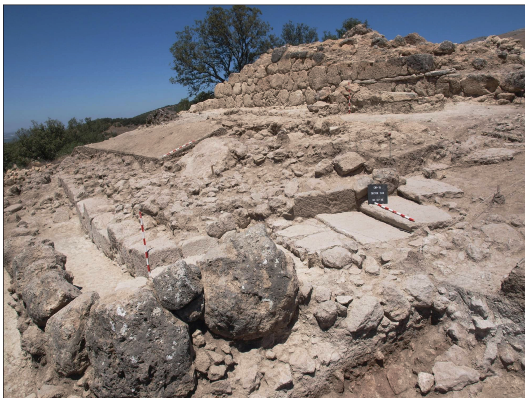
Fig. 3. Vista del exterior complejo desde el sureste. En primer plano, terraza inferior (parcialmente expoliada) y escalinata de acceso. En segundo plano, zócalo ciclópeo del edificio principal, de unos 20 metros de lado y más de dos metros de alzado conservado.

Como suele ocurrir en Arqueología, las perspectivas iniciales de nuestro trabajo se vieron pronto alteradas ante imprevistas complejidades. En principio parecía que nos encontrábamos (así había sido identificado en la bibliografía, Bernier et al. , 1981: 47-48) ante uno de tantos modestos 'recintos-torre' o 'atalayas' tardoibéricas que abundan en la Campiña y Subbética, (Fortea y Bernier, 1970; Bernier et al. , 1981; Serrano y Morena, 1984; Morena et al. , 1987; Murillo et al. , 1989; Morena et al. , 1990; Moret, 1990; Morena, 1996; Carrillo, 1999; Morillo et al. , 2014; Roldán y Ruiz, 2017; Moreno et al. , 2017). Se trata de una tipología de yacimientos sobre los que hay más publicaciones que excavaciones, y un largo debate en un contexto incluso de