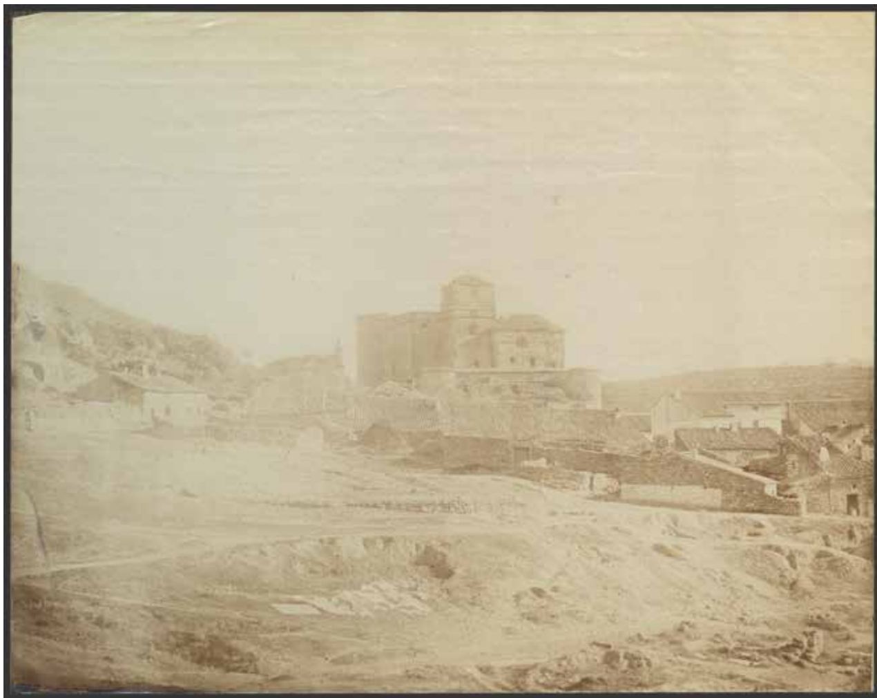
1. Castillo de Canena . ¿José Vasserot? (1880)