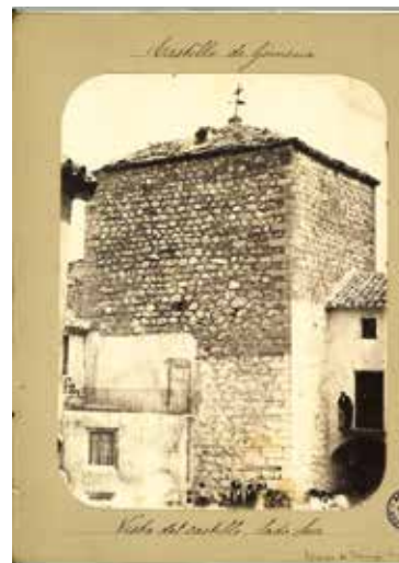
7. Vista del castillo, lado Sur. Domingo López, Baena (1880)

del Norte trece, por la de Poniente treinta y ocho, y por la del Sur veinte y cuatro. La Torre mide de capacidad superficial treinta y seis metros. No tiene puertas accesorias.