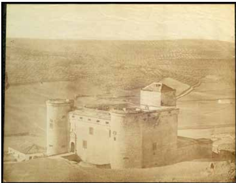
2. Castillo de Canena. ¿José Vasserot? (1880)