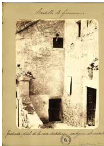
5. Fachada principal de la casa-habitación contigua al castillo. Domingo López, Baena (1880)