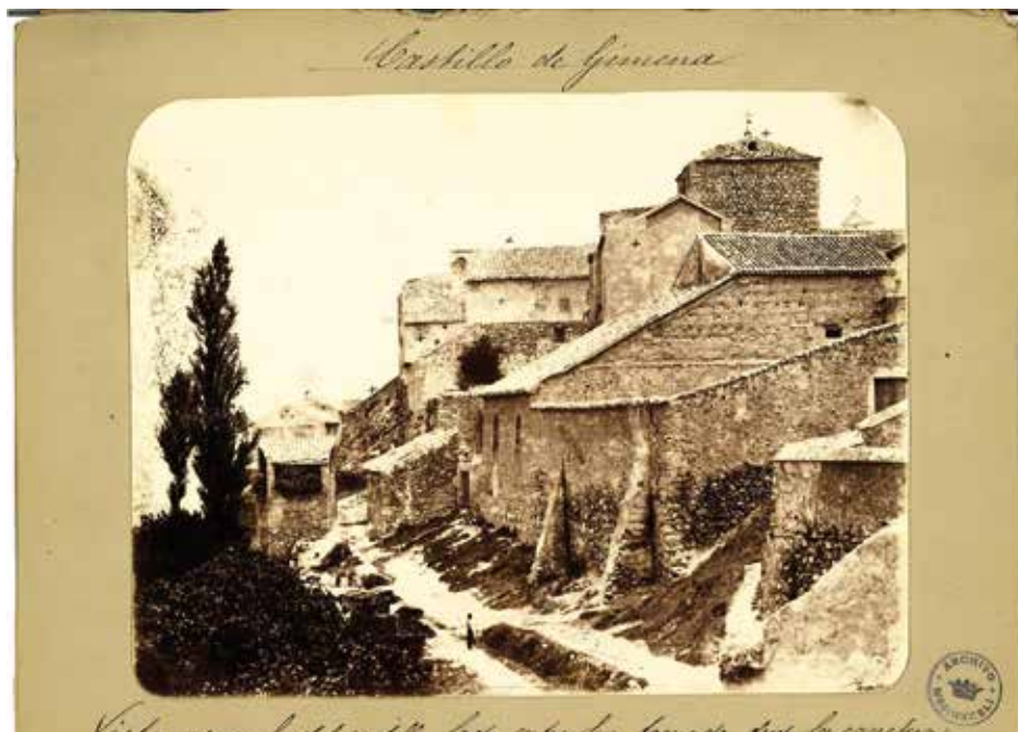
4. Vista general del castillo, lado entre Sur, tomada desde la carretera. Domingo López, Baena (1880)

Viuda inquilina, la que ha construido cochera y gran corral cercado, y que deberá recobrase porque carece de título de propiedad 21 .