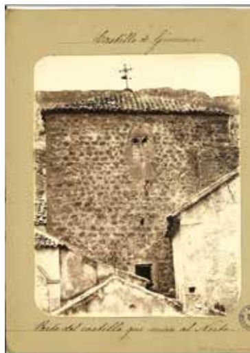
6. Parte del castillo que se mira al Norte. Domingo López, Baena (1880)