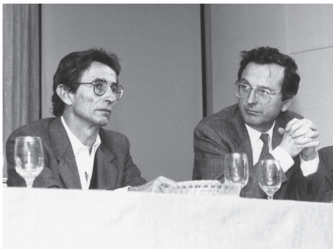
Amb Rafael Moneo