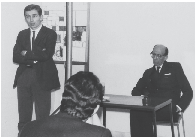
Amb José Luis López Aranguren