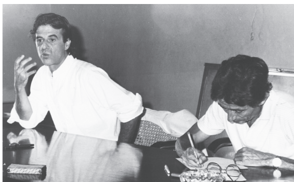
Amb Ricardo Bofill

Su libertad e independencia han marcado nuestra amistad y colaboración hasta hoy.