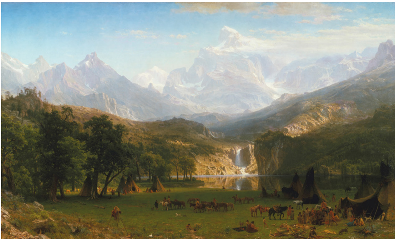
Fig. 1. The Rocky Mountains, Lander's Peak , Albert Bierstadt, 1863. Metropolitan Museum of Art (Accession Number: 07.123)

tiempo extraordinario y abundantes riquezas, como a otros que aseguran que se trataba un lugar inhóspito, salvaje y violento, no apto para la vida humana. Por esto mismo, era importante que alguien representase visualmente estos territorios que aún no habían sido alterados por la mano del hombre. Algunos de los primeros en hacerlo fueron pintores como George Catlin, Karl Bodmer, Charles Deas, Thomas Cole, F. E. Church o Albert Bierstadt (Figura 1), entre otros (NAEF y WOOD, 1975: 15). Este último, de hecho, llegó a participar en la expedición del Capitán Frederick W. Landers, realizando una serie de bocetos y estereoscópicas durante el viaje (CURRENT, 1978: 17).