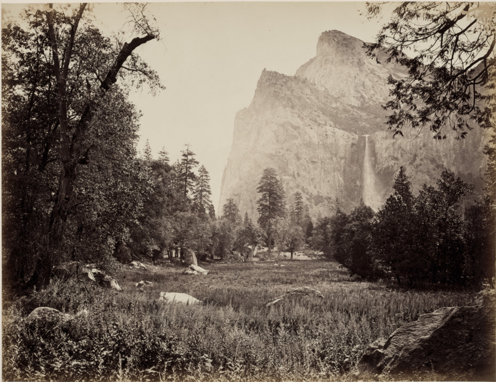
THE BRIDAL VEIL - 900 FEET - YOSEMITE