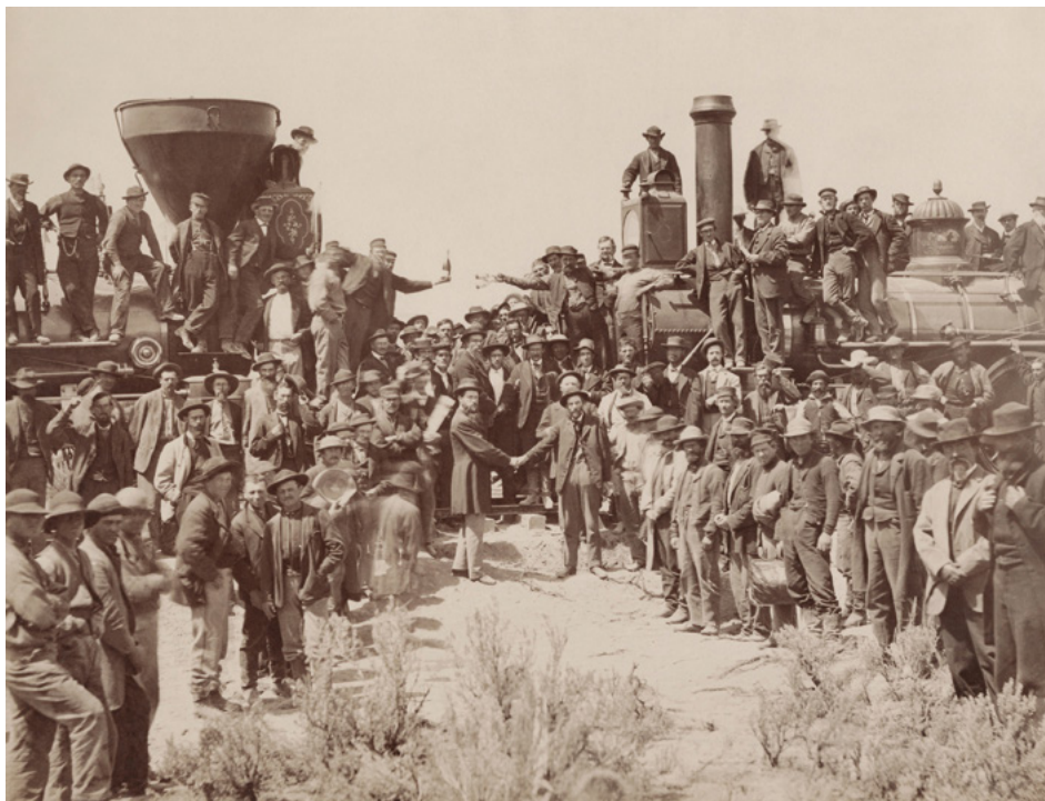
Fig. 8. East and West Shaking Hands at Laying Last Rail , Andrew J. Russell, 1869. Beinecke Rare Book and Manuscript Library, Yale University Library (OID 2014909; Image ID 1062118)