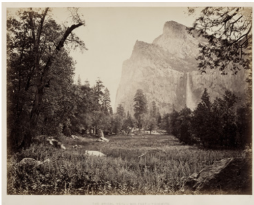
Fig. 7. Bridal Veil, Yosemite , Carleton E. Watkins, 1865-1866. The Cleveland Museum of Art, Andrew R. and Martha Holden Jennings Fund (1992.12)