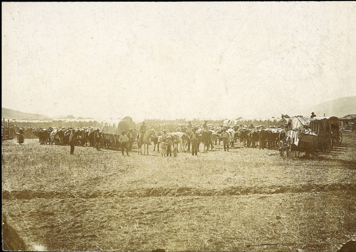
Brigham Young University Lee Library L. Tom Perry Special Collections; MSS P 24