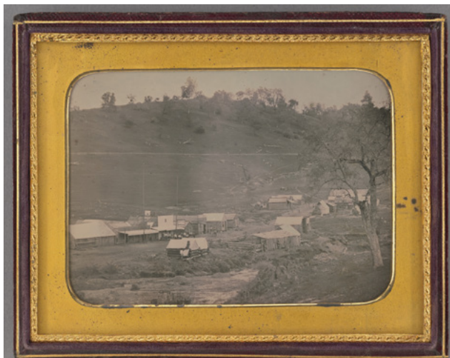
Fig. 5. [View of California mining town with Rancherie House, Unidentified Hotel, and Sweata & Francis Bldg], Robert H. Vance, 1853-1855. J. Paul Getty Museum (Object Number 84.XT.245)