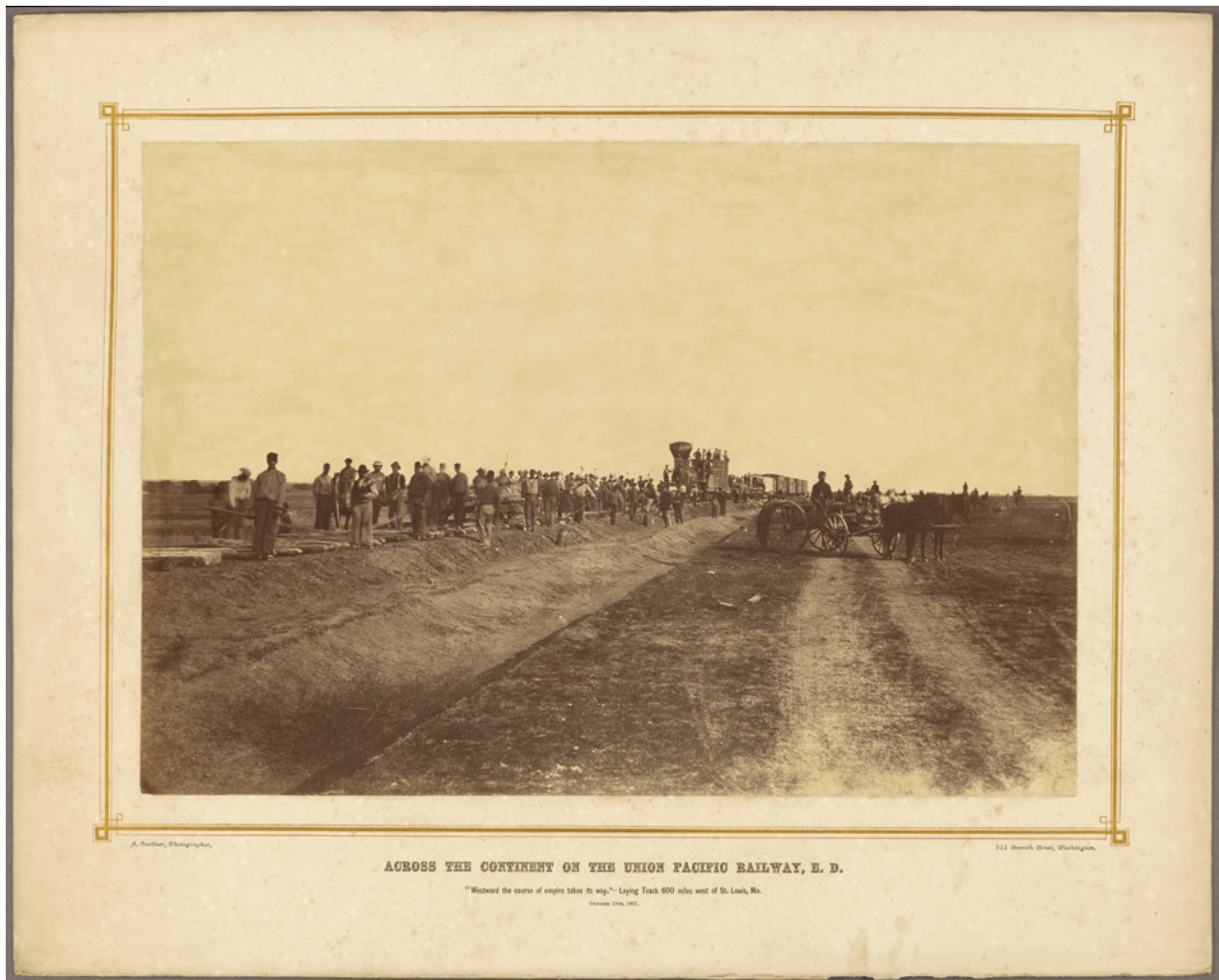
ACROSS THE CONTINENT ON THE UNION PACIFIC RAILWAY, E. D.

"Westward the course of empire takes its way."—Laying Track 600 miles west of St. Louis, Mo. Crossed June, 1867.