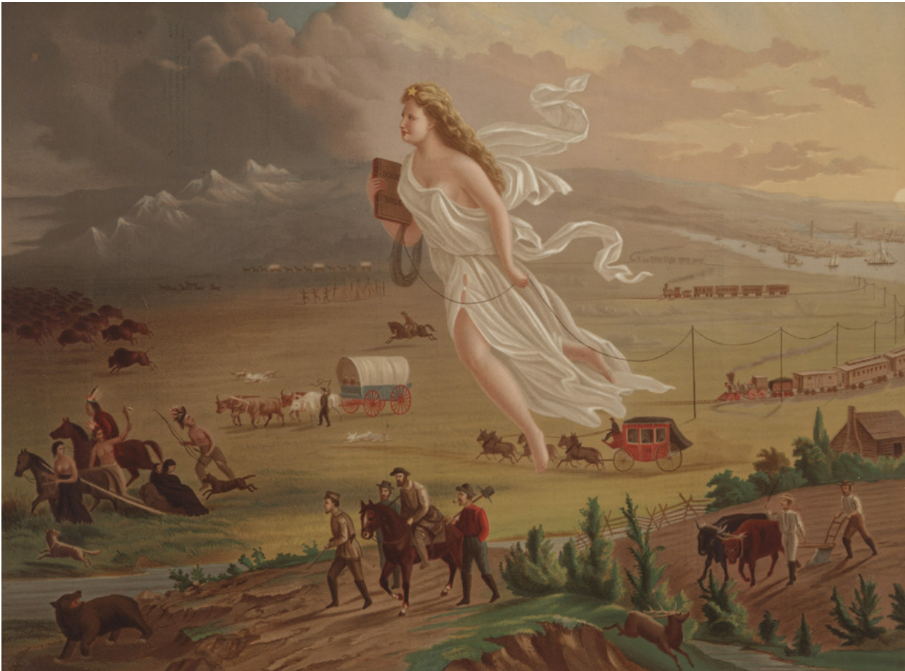
Fig. 2. American Progress , John Gast, 1872. Library of Congress (ref. LC-DIG-ppmsca-09855)

Muchas obras se impregnaron de la esencia del Destino Manifiesto (CLEE, 2003: 35) y buena prueba de ello la encontramos en la pintura de John Gast, American Progress (Figura 2). En el centro se alza una figura femenina que simboliza a la Divina Providencia, señalando el camino a los emigrantes, cazadores, mineros y al