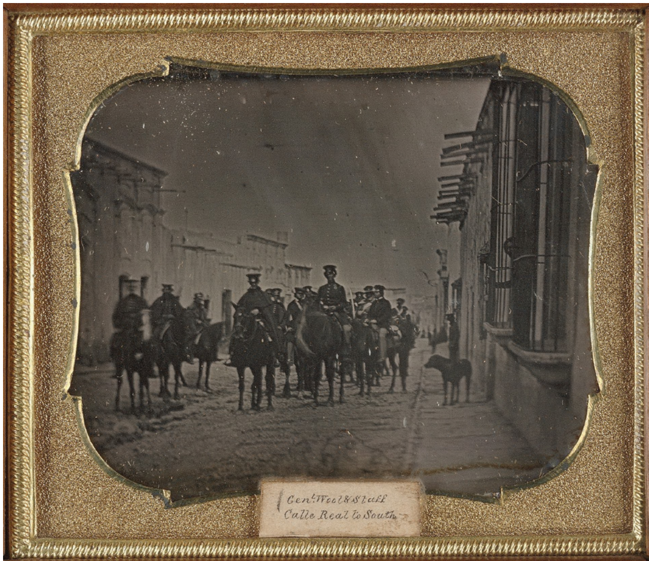
Fig. 3. Gen. Wool & Staff, Calle Real to South, Anónimo, ca. 1847-1848.