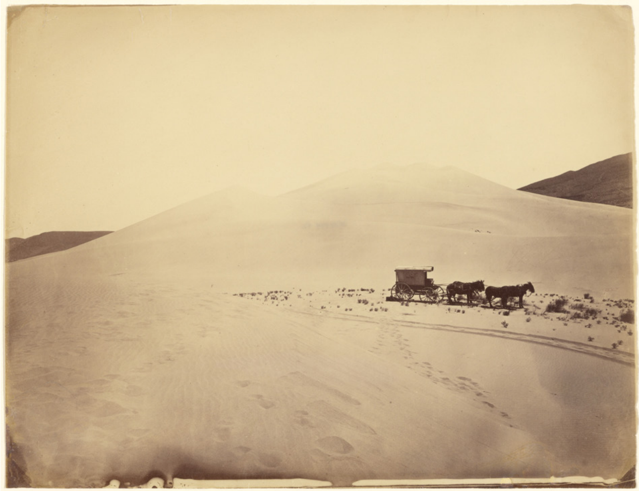
Fig. 6. [ Desert Sand Hills near Sink of Carson, Nevada ], Timothy O'Sullivan, 1867. J. Paul Getty Museum (Object Number 84.XM.484.42)