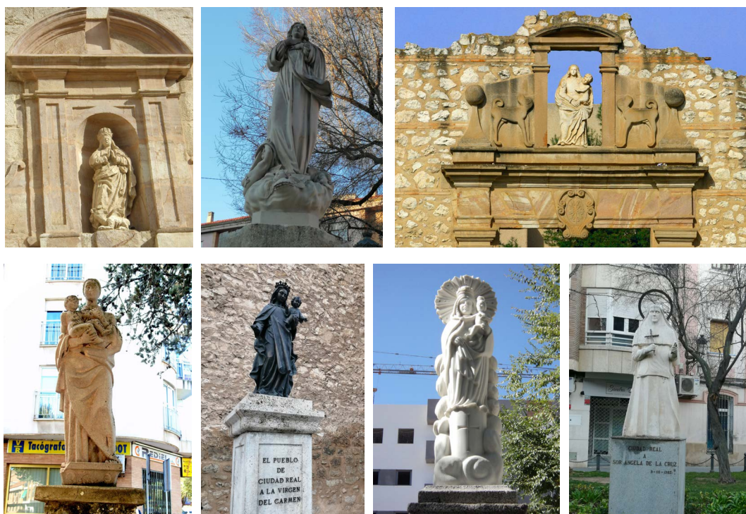
Fig. 4. Virgen Inmaculada . Portada Iglesia de la Merced. Autor desconocido. Siglo XVIII. Fuente: https://cutt.ly/nfPNK7v . Fig. 5. Virgen de la Inmaculada . Autor desconocido. 2008. Fotografía de la autora. Fig. 6. Virgen de Altagracia . Autor desconocido. Siglo XVI. Fuente: https://cutt.ly/5fPMi6o . Fig. 7. Virgen con el niño . Joaquín García Donaire. 1963. Fuente: https://cutt.ly/sfPMx2G . Fig. 8. Virgen del Carmen . Mariano Roldán. 1997. Fotografía de la autora. Fig. 9. Virgen del Pilar . Autor desconocido. h. 2000. Fuente: https://cutt.ly/Yfp8xmm . Fig. 10. Ángela de la Cruz . Fernando López Gómez. 1987. Fotografía de la autora

Respecto a la Virgen madre, modelo que se fijó durante el siglo V tras aprobarse la maternidad de la Virgen como dogma de fe por el Concilio de Éfeso, tenemos en las calles de Ciudad Real cuatro esculturas: la Virgen de Altagracia (s. XVI) (fig.6), que preside la Portada del antiguo Convento de las Dominicas en la Ronda de Santa María; la Virgen con el niño situada en la Plaza Puerta de Santa María (fig. 7), bella imagen clasicista, de reminiscencias itálicas (Prodan, 2003: 257), realizada por Joaquín García Donaire en 1964; la Virgen del Carmen (fig. 8), realizada en bronce por Marino Roldán Esturillo en 1997, situada en la Plaza del mismo nombre, que sustituye a la original destruida durante la Guerra Civil; y la Virgen del Pilar (fig. 9), situada en los primeros años del presente siglo en la Calle de Begoña. Iconográficamente, todas ellas son evoluciones de la Virgen odigitria , que sostiene a su hijo con un brazo y le señala con el otro, poniéndolo como ejemplo a seguir; o de la Virgen eleousa , que muestra un lado más humano, al acercar madre e hijo sus rostros demostrando un cariño mutuo.