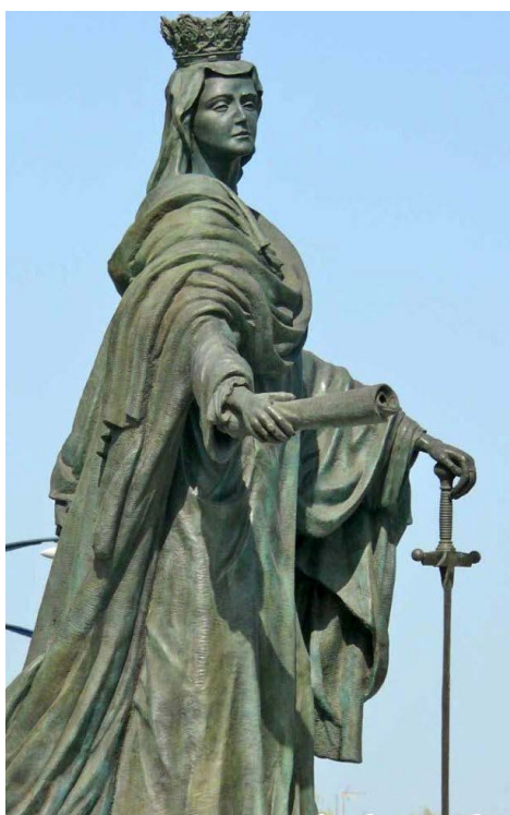
Fig. 13. Isabel la Católica . Carlos Guerra del Moral. 2009.