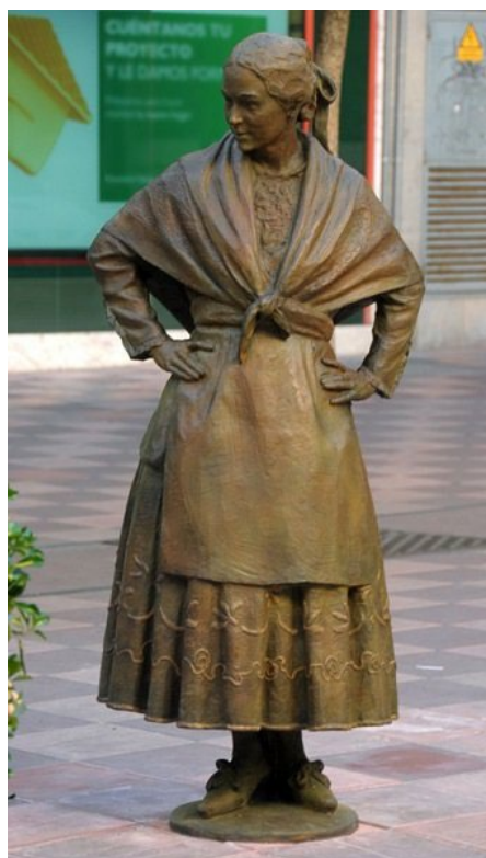
Fig. 11. Homenaje a la mujer manchega. Jesús Ruiz de la Hermosa. 2006.