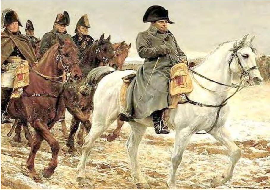
Cuadro de J. L. Meissonier, sito en el “Museo de Francia”, en Palacio de Versalles.

Aquel fue el hombre (solamente un hombre, como expondría ancestralmente el Senado de Roma ante César dentro de otro contexto histórico pretérito), aquel sería el hombre, insistimos, que sin saber con demasiada precisión dónde se hallaba la localidad de Almagro incidió de forma decisiva sobre la sociedad y la historia de dicha Villa y de La Mancha en conjunto. ¡Qué anónima puede ser la guerra en su devenir!, ¡qué anónima y qué cruel bajo el mismo tipo de mandato!... Le siguen en el Cuadro aludido sus mariscales, agotados y perfectamente perceptibles: Mortier, Moncey, Ney, Victor, Murat, Davout... Pero falta uno, Nicolás Sout, que se hallaba en la Península Ibérica, casi como Virrey de Andalucía.