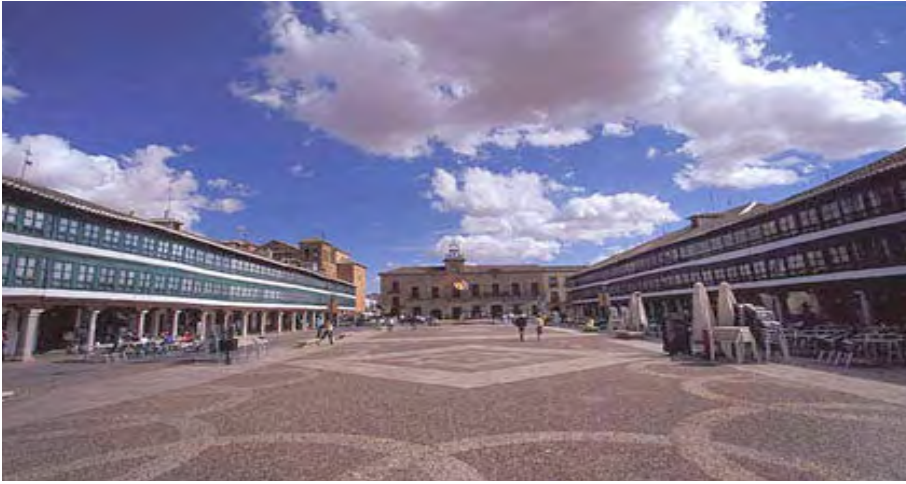
La Plaza Mayor de la longeva Almagro, exponente de los más brillantes del Antiguo Régimen; contradicción del nuevo esquema Liberal.