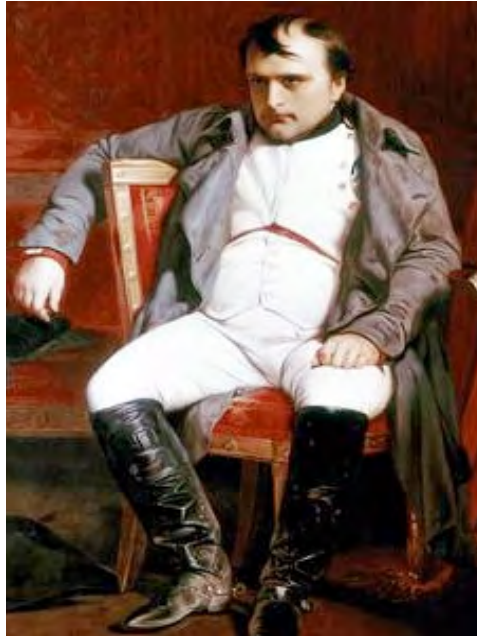
La Primera Abdicación de Napoleón I como Emperador. Paul de la Roche, 1845. Dependencias del Museo del Louvre.

De detentar todo el poder personal, al hundimiento. Desde las geografías de Europa, España y La Mancha, hasta las cenizas de un Imperio Personal. Aquí queremos reflejar las “contradicciones” individuales, sociales, locales, políticas y geográficas de toda una época, y tales “contradicciones” aún ofrecen multitud de textos por escribir en la Historia y en la Historiografía presente. Así pues, ¿porqué no: de Napoleón a Almagro, y desde Almagro hasta Napoleón.