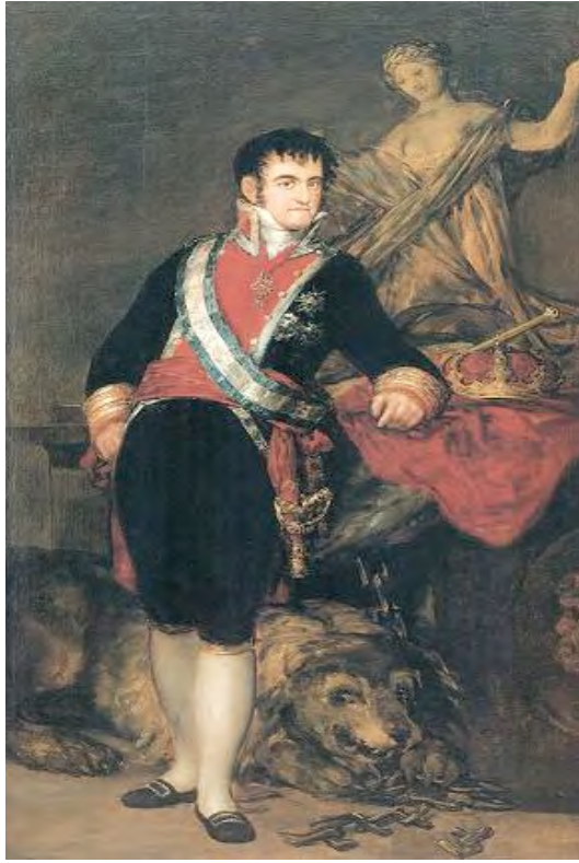
Fernando VII. Retrato de Francisco de Goya. Museo de Bellas Artes. Santander.

trepidante violencia transoceánica. Por supuesto, Almagro y su Partido Institucional no se libraron de tales avatares de “cambio histórico”, es decir, de avance (y pervivencias de retroceso) en la singladura colectiva del acontecer de su pasado.