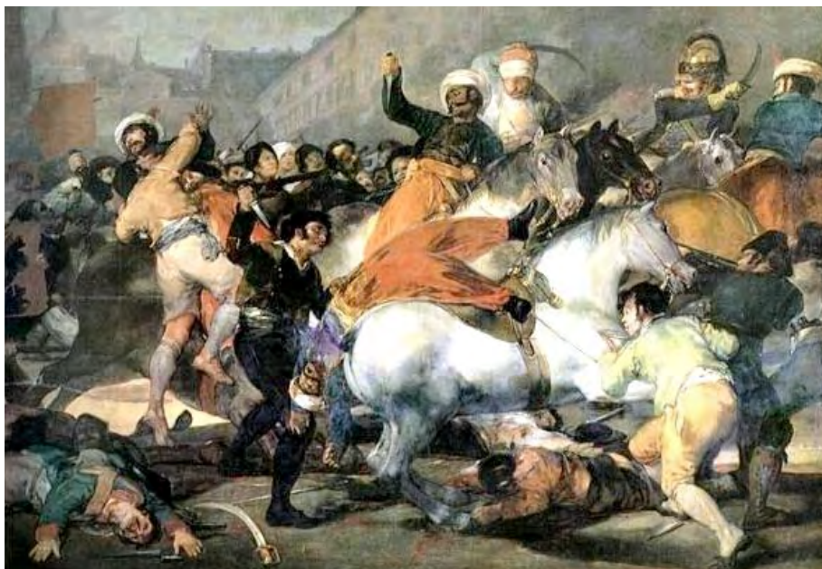
Obra de Francisco de Goya. “El 2 de mayo de Madrid”. Museo del Prado, Madrid.

Almagro y su Partido institucional, al igual que el resto de la pretérita y denominada Provincia de La Mancha (hasta la “Ley Javier de Burgos” de 1833), experimentaron entre los meses de mayo y junio de 1808 aquella “inmediatez”, y no sin razón; desde el Bando de Móstoles, como otros muchos municipios españoles y sus partidos del Antiguo Régimen en transición, Almagro se enfrentaba abiertamente, nada menos, que a Napoleón Bonaparte y sus “legiones” (y el 2 de mayo en Madrid, obviamente, de trasfondo).