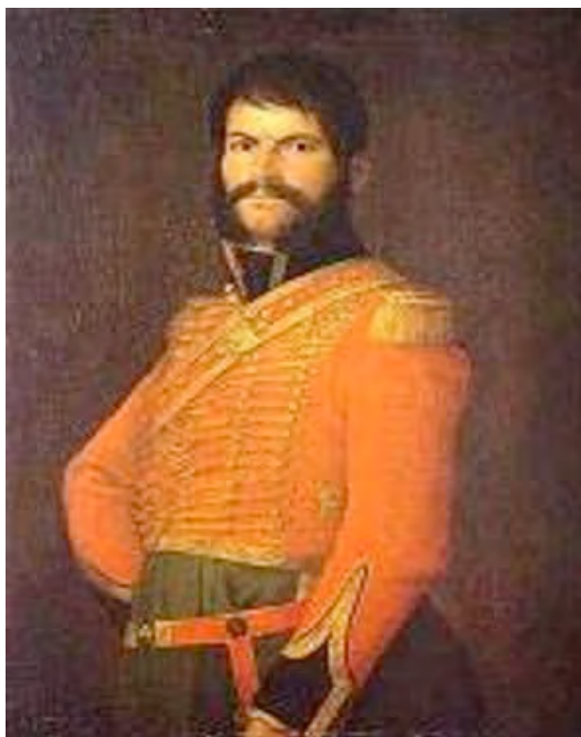
Retrato de Juan Martín “El Empecinado”. Francisco de Goya. Museo Nacional de Bellas Artes de Tokio, Japón (en depósito).

sus planes con urgencia en enero de 1809, saliendo de España al objeto de sofocar la Quinta Coalición frente a Viena y sus aliados 39 . La Batalla de Wagram (Austria) coincidiría en aquel mismo año con los éxitos iniciales de sus mariscales en la Península Ibérica, incluida la expulsión de la primera expedición inglesa al mando del general John Moore (Batalla de Elviña) a raíz de la ofensiva del mariscal Soult en las inmediaciones de La Coruña. Con respecto a la aludida y deslumbrante Institución del “ Gran Imperio Napoleónico ”, quedaba poco para que viese la luz; fue el cenit de su poder. A partir de entonces, desde Almagro a Moscú, quebró en vidas humanas y coste material.