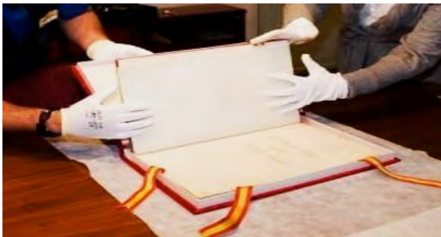
Original de la Constitución de 1812. Congreso de los Diputados. Sección Archivo General de Documentación.

Para todo lo expuesto, es necesario entender, especialmente, la existencia de un poderoso y trágico hilo conductor: la Guerra en sí misma contra el Imperio Napoleónico como factor transformador, violento y sin punto de retorno entre 1808 y 1814. La Guerra de la Independencia (la cual fue denominada de esta hechura gramatical, y desde el inicio, por las fuentes de la época) 4 , como proceso de engarce entre Almagro, La Mancha, España, Europa, la Constitución de 1812 y el Emperador Napoleón I. Y en tales planteamientos, siguiendo nuestra línea de trabajo expuesta en diversas ocasiones: el extenso territorio manchego (incluido el trascendental combate de Ocaña del 19 de noviembre de 1809) se habría de convertir en un inmenso “campo de batalla” a lo largo del período 5 ... Campo de batalla para el control hacia el Sur de Andalucía y, hacia el Norte, de Madrid y su hinterland , costando miles de vidas de