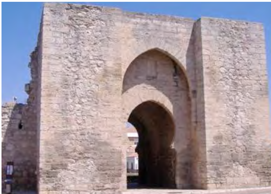
El símbolo de Ciudad Real: “La Puerta de Toledo” (antigua muralla), Ciudad Real; José M. Breal. Aquí se consumó parte de la resistencia local frente a las tropas imperiales en marzo de 1809.

Al cobijo de reivindicaciones de tanto peso, y como consecuencia del inminente peligro de ocupación, las elites cedieron en sus cerrados intereses y, de esta manera, tanto las capas dirigentes de Almagro como las de Ciudad Real (así como también las de la cercana Infantes) no tuvieron más remedio que tomar posiciones frente a lo inevitable: los franceses amenazaban el territorio y, por tanto, no era momento de rencillas provinciales. Así pues, y dentro de tales asertos, la Urbe almagraña al final reaccionó dentro de las directrices de “lo local”, surtiendo por fin debidamente (y aun con todos sus defectos institucionales y sociales), de víveres y hombres al conjunto de las zonas que lo volvieron a demandar a lo largo de su vasto Partido, por encima incluso de la mentada rivalidad con Ciudad Real (y también frente al referido pulso con la vecina área de la Junta de Infantes). A tal efecto, Ciudad Real en específico (así como la propia Infantes), frente a la amenaza popular de un lado, e Imperial de otro, hizo lo propio para cubrir de hombres armados las inmediaciones de Sierra Morena. En el fondo, no olvidemos que la Guerra de la Independencia, por todos los documentos, fue un combate contra los invasores externos, pero también una pugna entre elites y, lo que