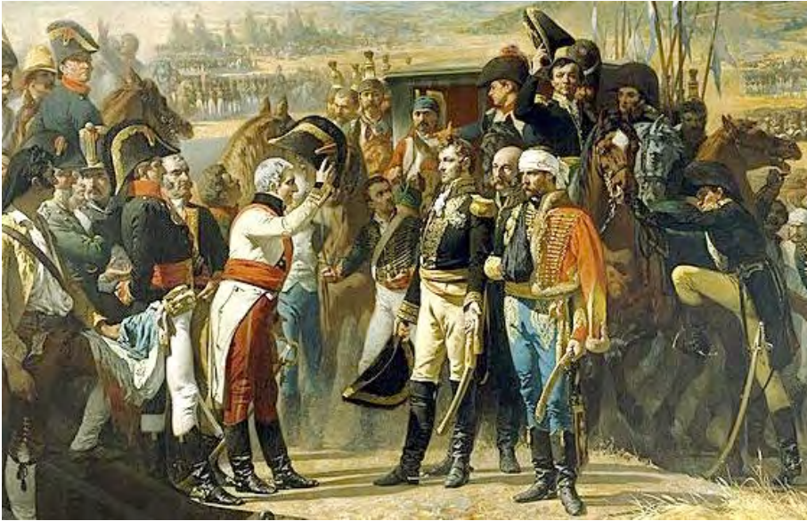
La Rendición de Bailén. Obra de Casado de Alisal. Dependencias Exteriores del Museo del Prado, Madrid.