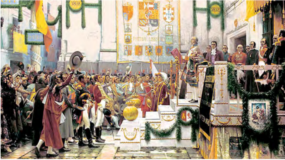
Fuente: La proclamación de la Constitución de 1812. Por S. de Vineagra. Museo de Cádiz.