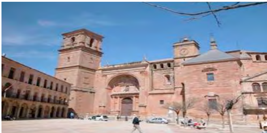
La Clásica Plaza Mayor de Villanueva de los Infantes, en Guiarte.com. Copyright.

tos de la población de Almagro al calor de las muy diferenciadas maneras de “Proclamar la Constitución de 1812” en la otra Urbe rival de Villanueva de los Infantes, siendo necesario entonces pasar, del análisis local, al estudio provincial comparado.