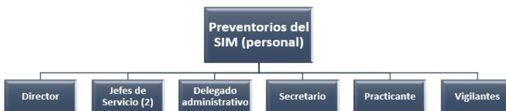
Gráfico 2. Composición de la plantilla de un preventorio del SIM