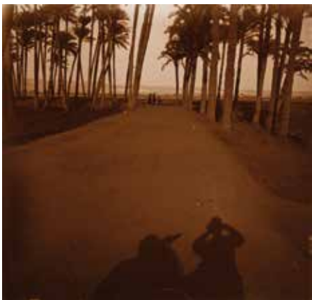
1. La sombra del fotógrafo y su acompañante en las cercanías del Nilo. 1909.

La relación de la fotografía con el acto turístico es un hecho innegable desde prácticamente el inicio de este arte. Los primeros colodionistas encontraron en las imágenes de lugares exóticos una fuente de inspiración, y de ingresos, concretada en la realización de series descriptivas de países y paisajes. Esta unión perdura hoy en día con unos medios técnicos muy diferentes a los de 1860 o los de inicio de siglo XX, aunque seguramente las pautas de representación que se marcaron en esas lejanas épocas están aún vigentes en las fotografías de nuestros móviles.