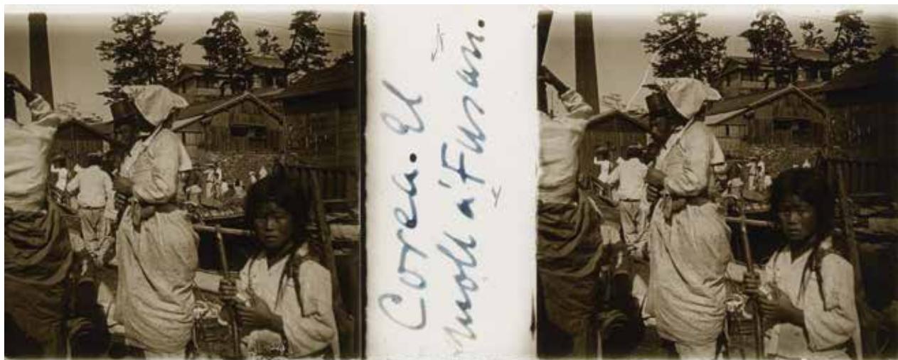
2. Corea. Pusan. Mercado del pez . 1909. Placa estereoscópica autografiada de Oleguer Junyent

Unos años después decide emprender un viaje alrededor del mundo con el propósito de acumular impresiones colorísticas para aplicarlas luego a sus trabajos escenográficos y decorativos. Así, el 13 de marzo de 1908 parten a recorrer el mundo en un trayecto organizado por las incipientes compañías de viajes provistos de cuadernos, lápices, acuarelas y una cámara estereoscópica Verascope de Jules Richard, con la cual realizará unas 400 placas negativas de 4,5x11 cm. La forma de abordar la realidad a través de la cámara se asemeja a la de sus dibujos: capta impresiones, sin atender excesivamente a la composición o a la nitidez de la imagen, aunque su mirada de artista le hace recabar en composiciones logradas. A pesar de encontrar-se permanentemente en medio de impresionantes monumentos, no le interesan estos como tales sino como parte de la sociedad, del paisaje humano (Fig. 2), de los colores del entorno. En cierta forma, tiene una mirada escenográfica propia de su ocupación como pintor de decoraciones teatrales.