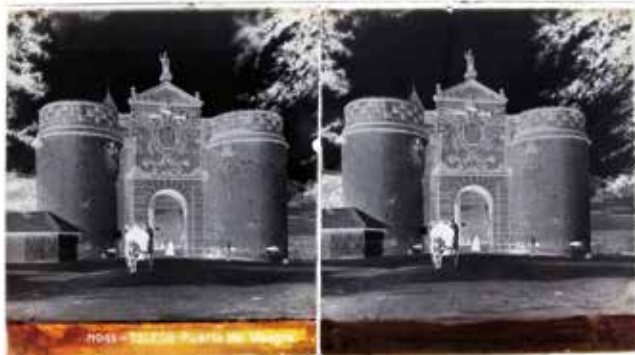
4. "Toledo. Puerta de Visagra". Negativo estereoscópico de 9 x 18 cm, con la leyenda inferior que aparecerá en el positivado de la imagen