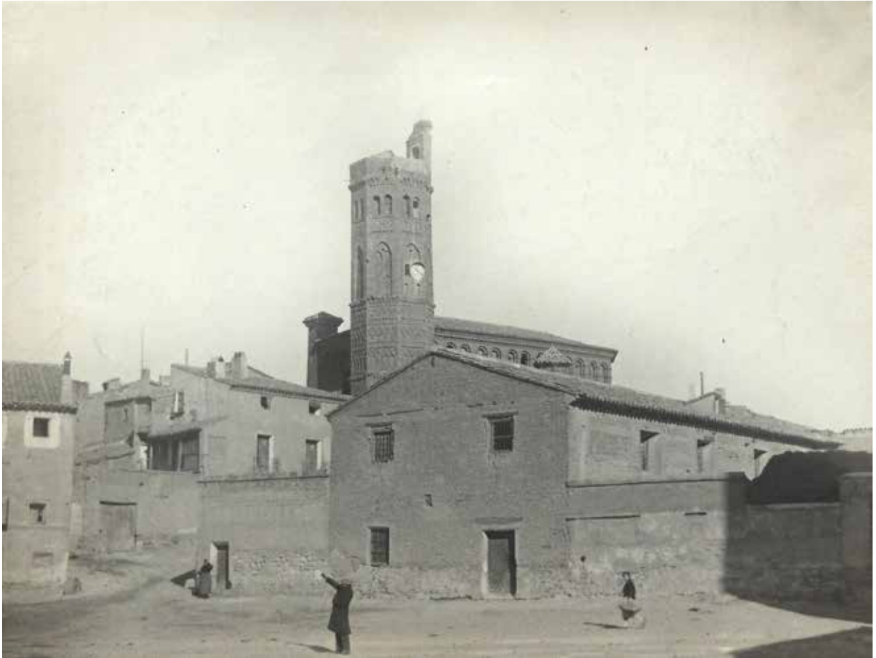
5. "Alagón". Uno de los componentes del viaje, posiblemente Xavier Nogués, mostrando un cartel con el número 8, correspondiente a la clasificación del monumento en los criterios internos del viaje. Octubre 1927. Noviembre 1927