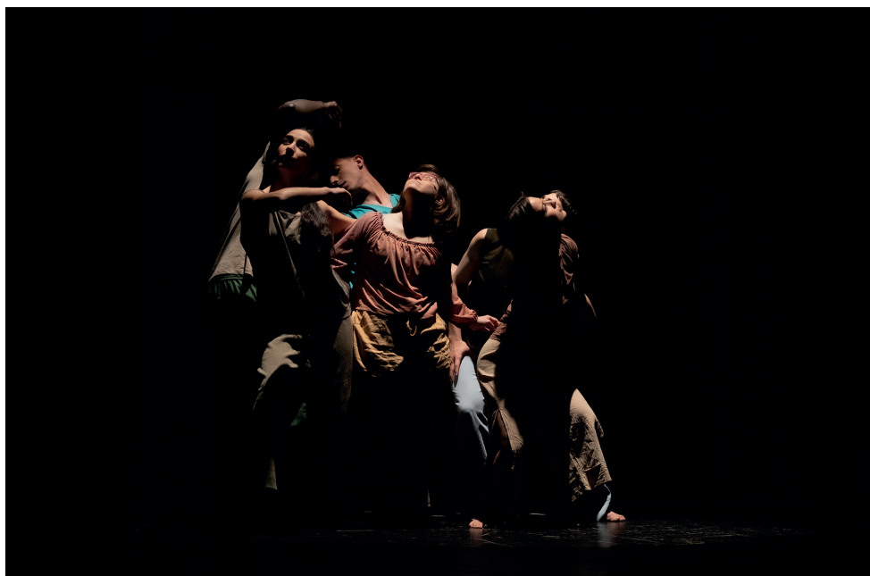
“Estamos a tiempo”. Dir. José Ramón Marcos.

Creo firmemente en el poder de la cultura, en su gran capacidad de transformarnos como seres humanos y, por ello, no considero que nuestro proyecto no esté estrictamente ligado a necesidad de demostrar que nuestra sociedad necesita modelos y espacios más diversos, dejar atrás los estigmas que hemos heredado sobre quién es capaz o posible o cuál es la manera correcta de crear arte. Nadie somos poseedores del arte, es algo que nos ha acompañado y acompañará para siempre y, por ello, pienso seguir en este camino; absolutamente convencido de que hay muchas personas remando en la misma dirección aunque estemos en caminos separados y no, no pienso rendirme porque después de tres años y todo lo vivido no puedo estar más convencido de que es el momento, de que estamos a tiempo.