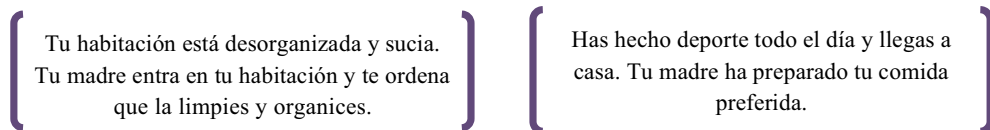
Fig. 9 y 10: Actividad 12

12. En parejas, escenificad una de las siguientes situaciones ante el resto de compañeros empleando el vocabulario visto en las actividades anteriores. Previamente elaborad un borrador con vuestras ideas. Con esta actividad te comunicarás empleando el léxico coloquial sobre la alimentación y las tareas domésticas.