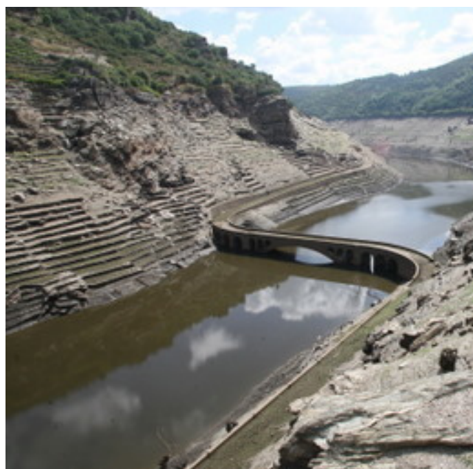
Imagen 5. Otra panorámica de “Ponte Mourulle” y de la carretera, construida por presos republicanos, al descubierto en 2011 en el embalse de Belesar.