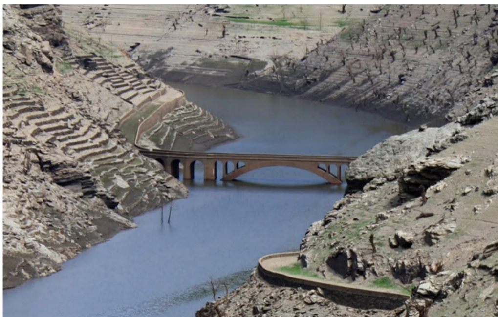
Imagen 4. Vista de “Ponte Mourulle” y de la carretera construida por presos republicanos, al descubierto en 2011 en el embalse de Belesar.