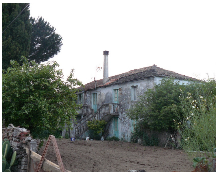
Imagen 1. "A Casa do Campo" en Friamonde, Taboada.

Desconocemos si estos presos sabían qué finalidad se le daría a esta casa; lo que sí sabemos es que los vecinos de este lugar (de apenas tres casas a día de hoy, pero con cerca de treinta casas a inicios de los años cuarenta 11 ) desconocían por completo la función que cumpliría esta en un primer momento 12 . Sea como fuere, esta vivienda, conocida como 'A Casa do Campo' sería el epicentro de dicha realidad punitiva franquista. Y es que una vez finalizada por completo esta casa, sería el lugar donde pernoctarían, entre 1942 y 1945, casi cien presos políticos republicanos. La vigilancia de dicho emplazamiento corría a cargo de guardias civiles 13 .