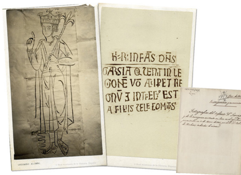
Fig. 8. Calcos epigráficos de la lápida y del epitafio de la tumba del infante D. García. Casimiro Alonso García. 1865. Real Academia de la Historia

Se han localizado también copias de las dos fotografías en la biblioteca de la Fundación Lázaro Galdiano (Madrid), en el fondo epistolar de Pedro de Madrazo y Kuntz 43 . Los ejemplares fotográficos fueron enviados adjuntos a una carta remitida por Jaime Serra i Gibert 44 a Pedro de Madrazo, fechada de 19 de marzo de 1865.