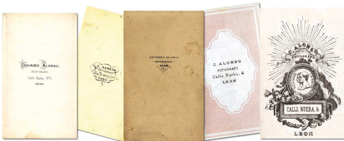
Fig. 1. Reversos de cartones de fotografías de Casimiro Alonso Ibáñez con detalle de la dirección de su galería, así como la referencia a los 'padres' de la fotografía Niépce y Daguerre

formaron parte de los catálogos de las exposiciones universales, nacionales y regionales del siglo XIX 26 .