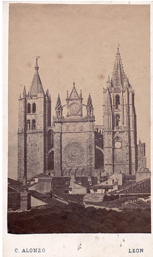
Fig. 5. Fachada principal de la Catedral de León. Casimiro Alonso Ibáñez. ca. 1862. Colección particular Amando Paniagua

de una irrefrenable ruina. Finalmente, hubo que acometer también la reconstrucción de la fachada principal del templo, que en la (Figura 5) se aprecia aún intacta, tal y como se conoció hasta su reconstrucción avanzado el siglo XIX.