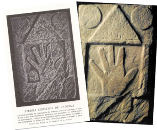
Fig. 7. Lápida votiva del siglo III d.C. La pieza original se encuentra actualmente expuesta en el Museo de León