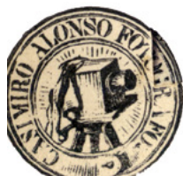
Fig. 2. Dos fotografías de las localizadas hasta el momento llevan estampado un sello en el que se reproduce su nombre y la condición de fotógrafo en círculo rodeando una cámara fotográfica de cajón