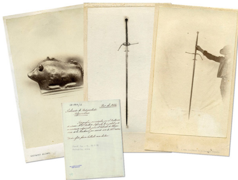
Fig. 6. Ex voto con forma de jabalí y espada del XVI . Casimiro Alonso Ibáñez. 1864. Real Academia de la Historia