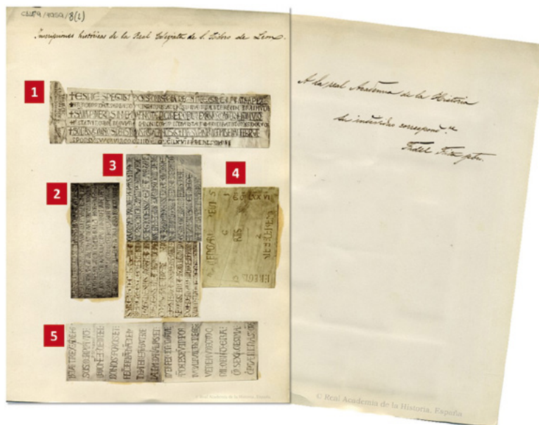
Fig. 10. Calcos epigráficos de epitafios sepulcrales y de inscripciones latinas medievales. Casimiro Alonso García. 1866. Real Academia de la Historia

Pedro Deustamben fue el maestro de obras de la basílica de San Isidoro. Reconstruyó la parte alta de la basílica y añadió el brazo del crucero. Fue enterrado en el Panteón Real en tiempos de Alfonso VII “El Emperador” y su hermana Sancha Raimúndez. (Jaén González, 2019: 378).