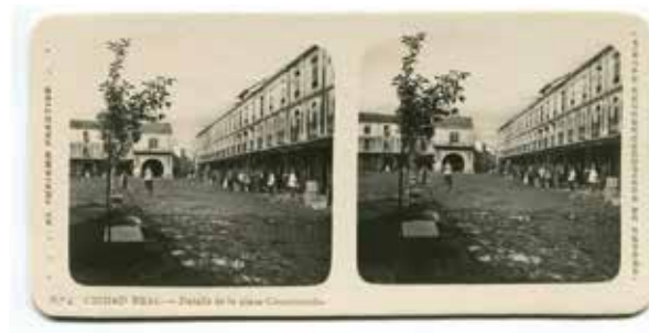
3. Ciudad Real, Detalle de la plaza de la Constitución. Centro de Estudios de Castilla-La Mancha

diversos daños en su estructura, especialmente por el terremoto de Lisboa acontecido en 1755 e incendios. Debido a las condiciones ruinosas de la estructura del edificio, en 1864 fue declarado edificio en ruinas, y en 1868 se iniciaron en la parcela de enfrente las obras del nuevo ayuntamiento (Fig. 3).