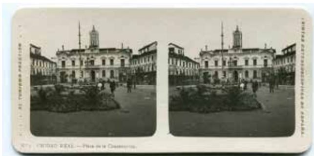
4. Ciudad Real, Plaza de la Constitución. Centro de Estudios de Castilla-La Mancha