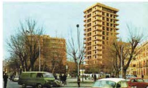
7. Plaza del Pilar de Ciudad Real, publicado en Boletín de Información Municipal de 1967. Centro de Estudios de Castilla-La Mancha