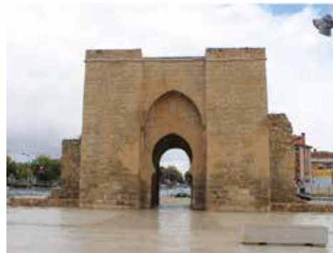
10. Puerta de Toledo en la actualidad

dad Real a principios del siglo XX y observar las modificaciones urbanísticas que ha tenido la ciudad. Como podemos observar con el estado de la Puerta de Toledo (Figs. 9 y 10).