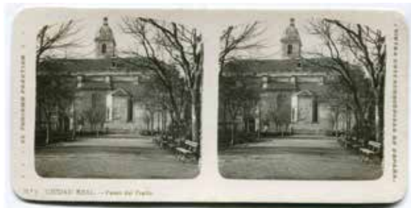
2. Ciudad Real, Paseo del Prado. Centro de Estudios de Castilla-La Mancha