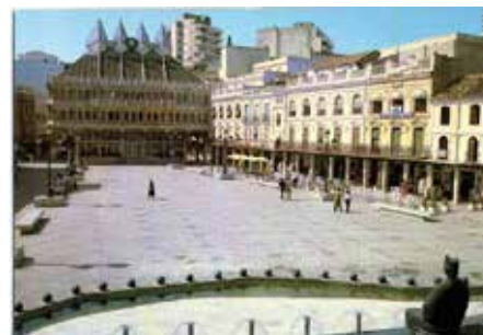
5. Plaza Mayor de Ciudad Real. Centro de Estudios de Castilla-La Mancha

La Plaza del Pilar era otro de los puntos de encuentro de la ciudad y cuya tradición sigue vigente. Es otra de las imágenes de la colección que muestra el patrimonio desaparecido de Ciudad Real.