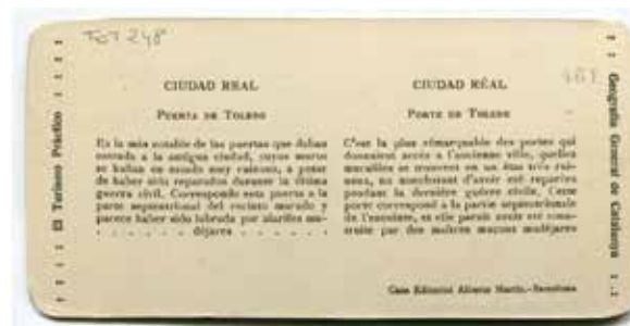
1. Dorso Ciudad Real, Puerta de Toledo. Centro de Estudios de Castilla-La Mancha

La segunda modalidad amplió el número de ciudades fotografiadas. Es en esta modalidad donde aparece Ciudad Real. Además, se vio modificado el número de vistas que contenía cada carpeta, en este caso eran 12 y también estaban numeradas, también se redujo el tamaño de éstas, 8.5x17 cm y se eliminó la descripción en inglés que había en el dorso de la imagen (MARTOS CAUSAPÉ y RUIZ ROJO, 2007: 21) (Fig. 1).