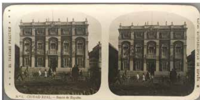
8. Ciudad Real, Banco de España. Centro de Estudios de Castilla-La Mancha