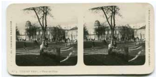
6. Ciudad Real, Plaza del Pilar. Centro de Estudios de Castilla-La Mancha